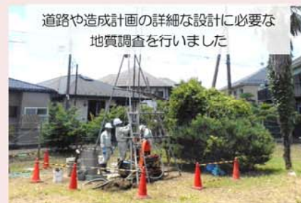
第1期地区の事業の概要は、裏面をご覧ください。