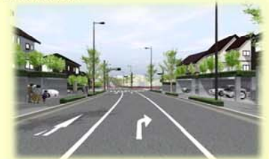
事業完了後の都市計画道路沿いの街なみのイメージ

◆第1期地区と第2期以降地区が完了すると、相鉄線三ツ境駅から瀬谷駅までを結ぶ都市計画道路が完成します。なお、都市計画道路沿いは無電柱化を予定しています。