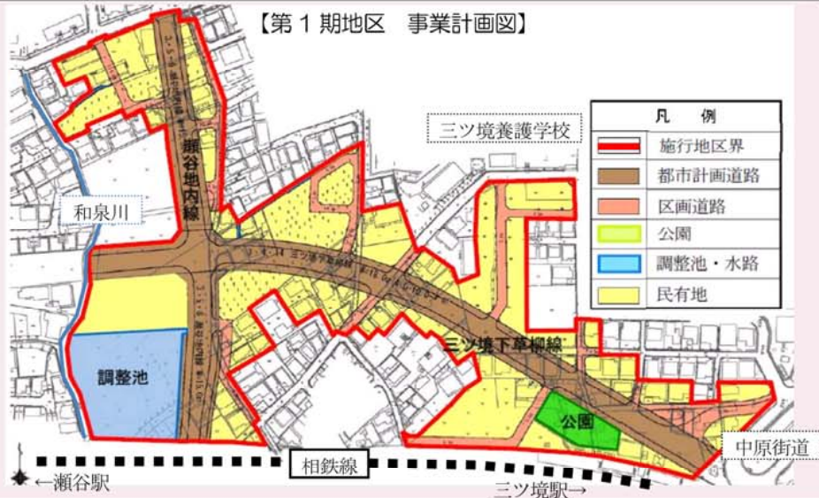
【第1期地区 事業計画図】