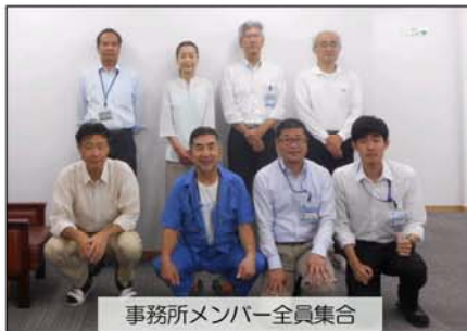
事務所メンバー全員集合