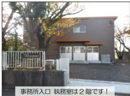
事務所入口 執務室は 2 階です！