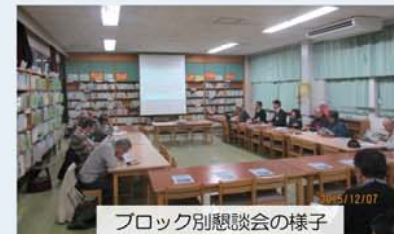
ブロック別懇談会の様子