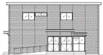
【北側立面図（建物出入口側）】