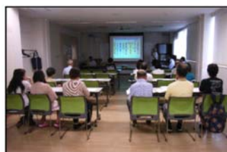
せやまるふれあい館