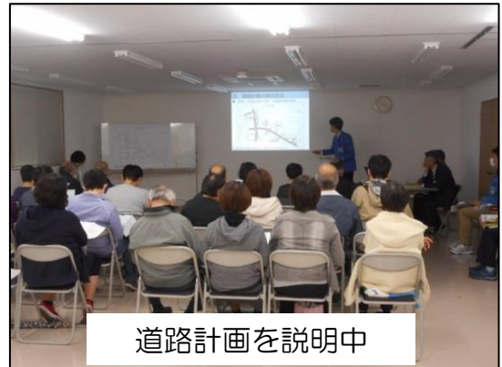
道路計画を説明中