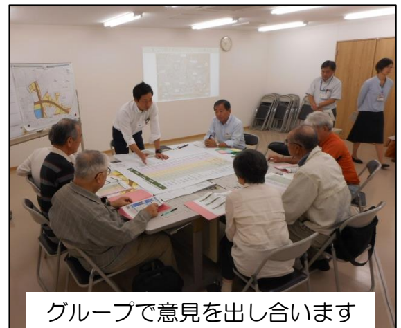
グループで意見を出し合います