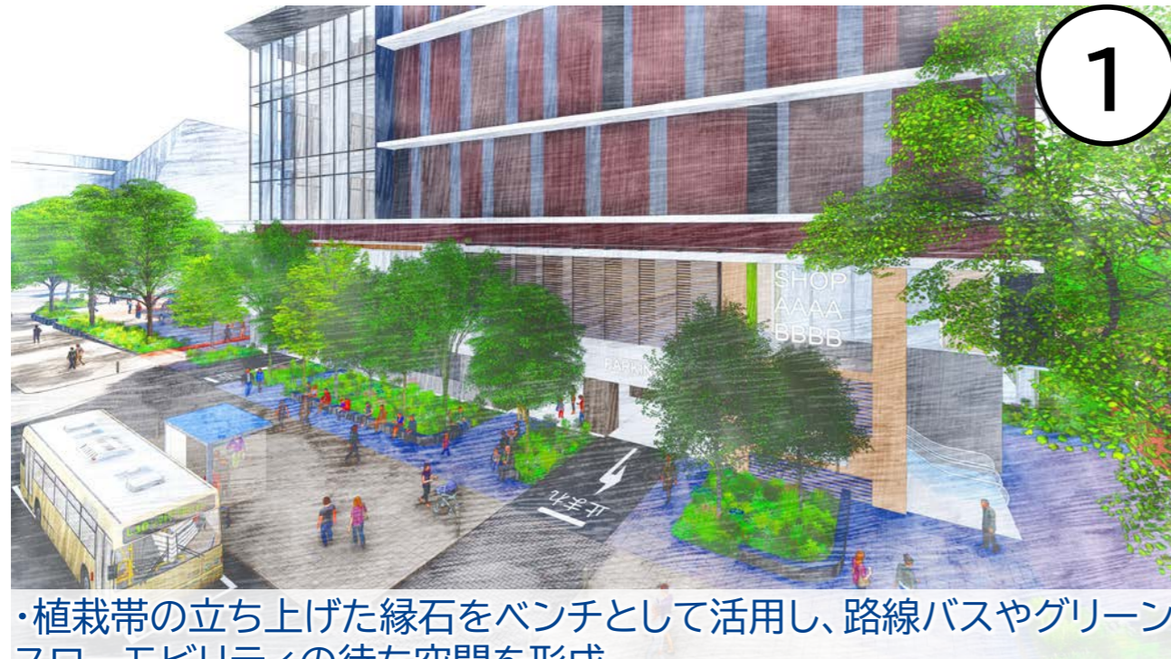
・植栽帯の立ち上げた縁石をベンチとして活用し、路線バスやグリーンスローモビリティの待ち空間を形成

尾上町通りに面するモビリティステーションについて、開放的な設えとなるよう工夫を施すこと