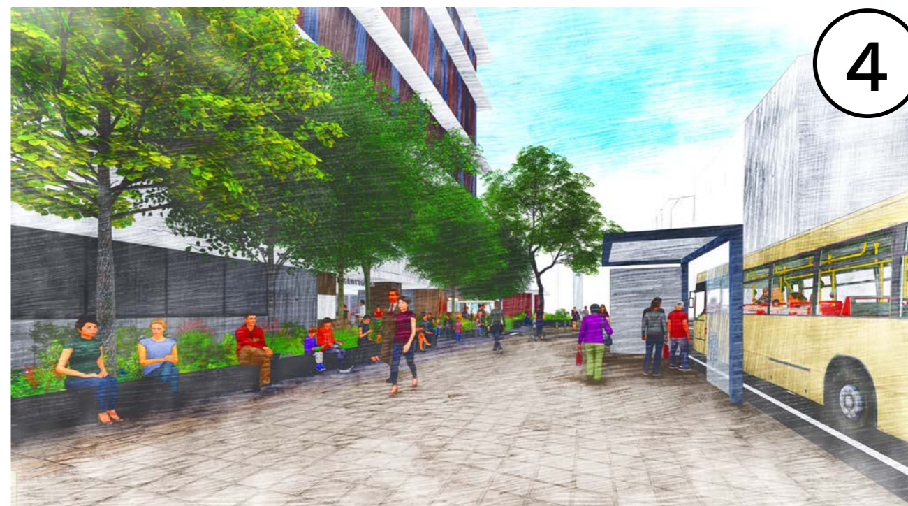
・モビリティステーションと店舗エントランスの外装意匠を合わせ、一体感を演出