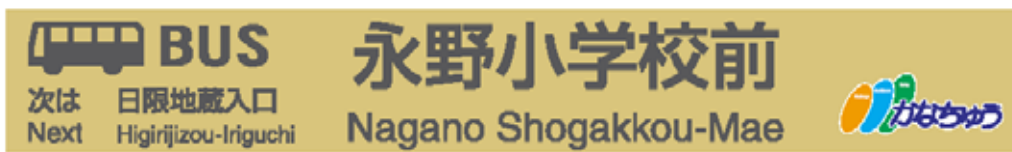
図 - 2

サイズ：横 9 0 0 mm × 縦 1 2 5 mm (サイズは市交通局と同一)