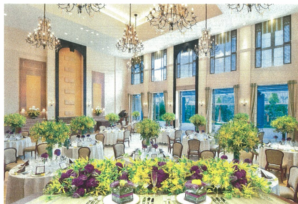
プロヴァンスのナチュラルな邸宅をイメージ