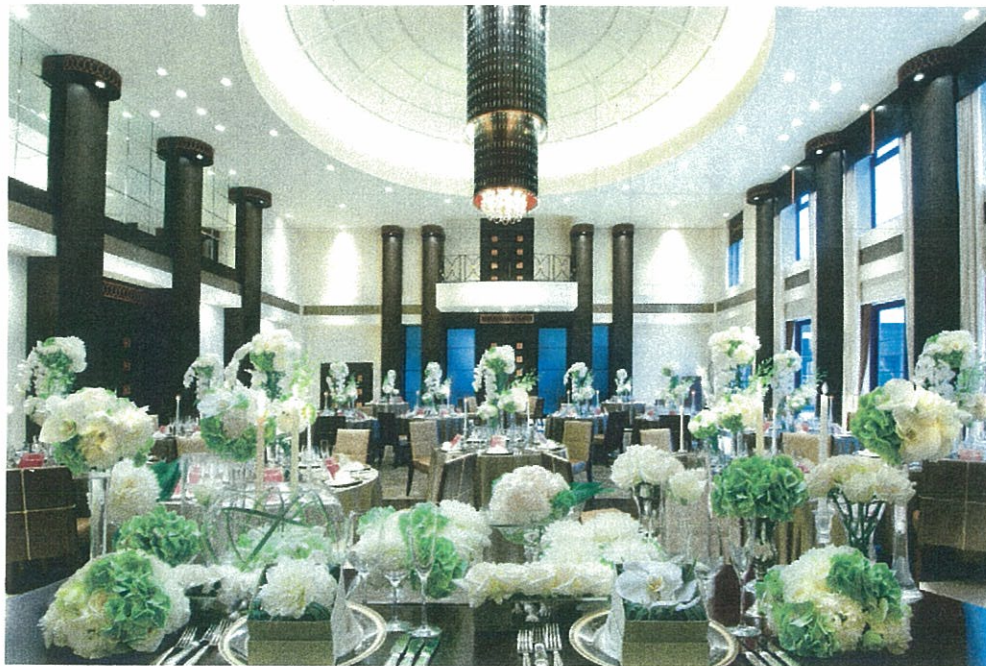
パリのモダンな邸宅をイメージ

内部のインテリア環境と外装デザインを一体化して、それぞれの邸宅の特長を表現しています。