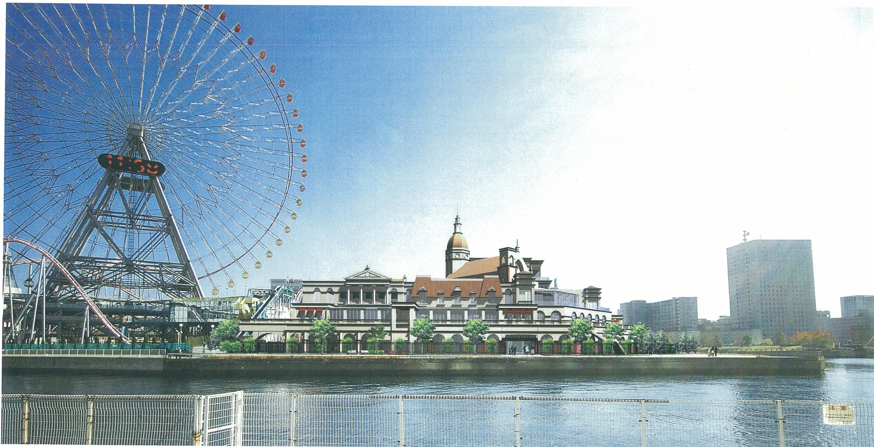
5. 西側コスモワールドより見る