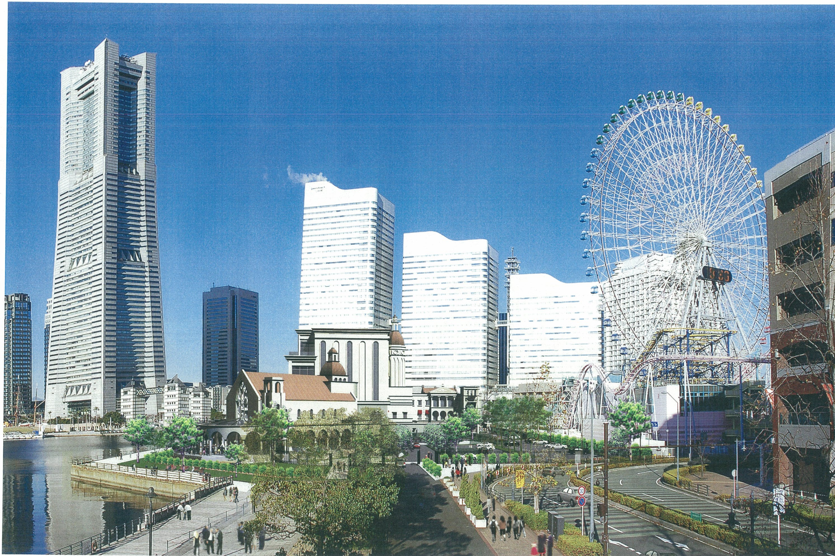
4. 運河パークより見る