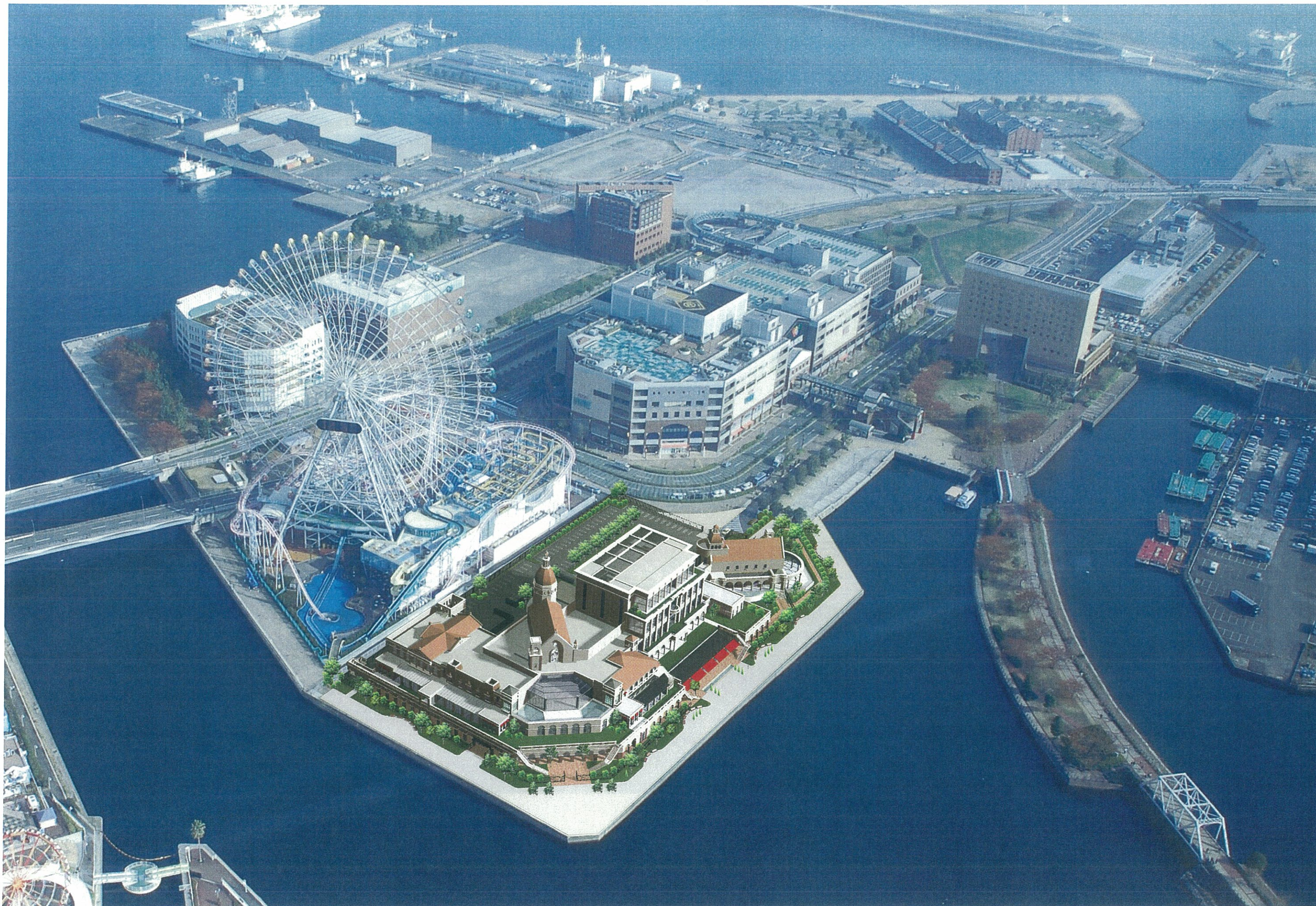
6. ランドマークビル 69 階より見る