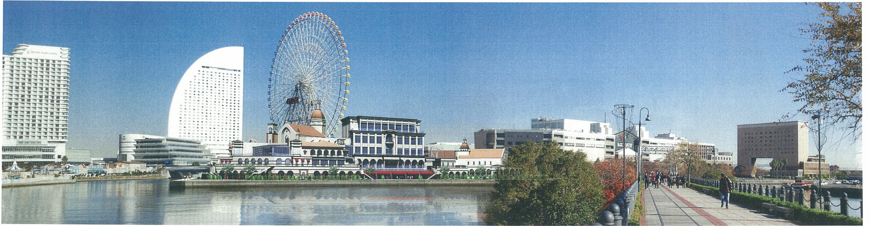
2. 自動車道より建物正面を見る