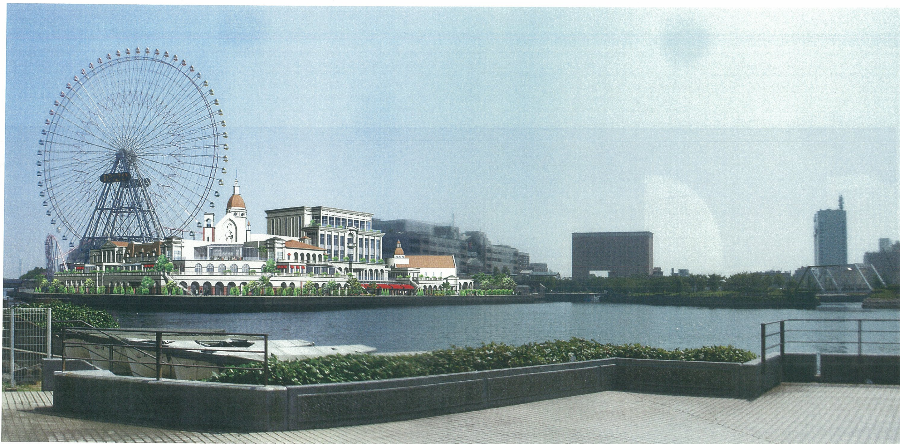
1. 日本丸メモリアルパークより見る