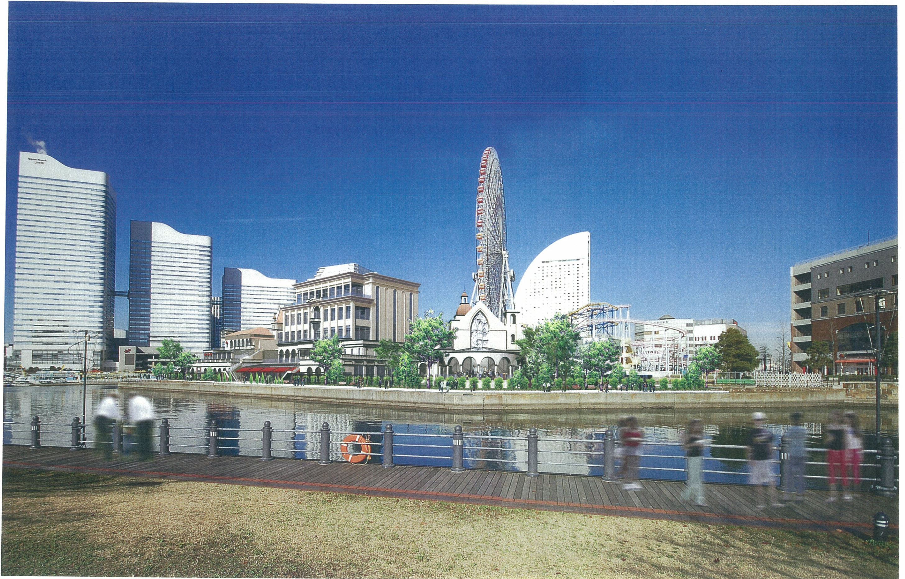
3. 自動車道より建物南東を見る