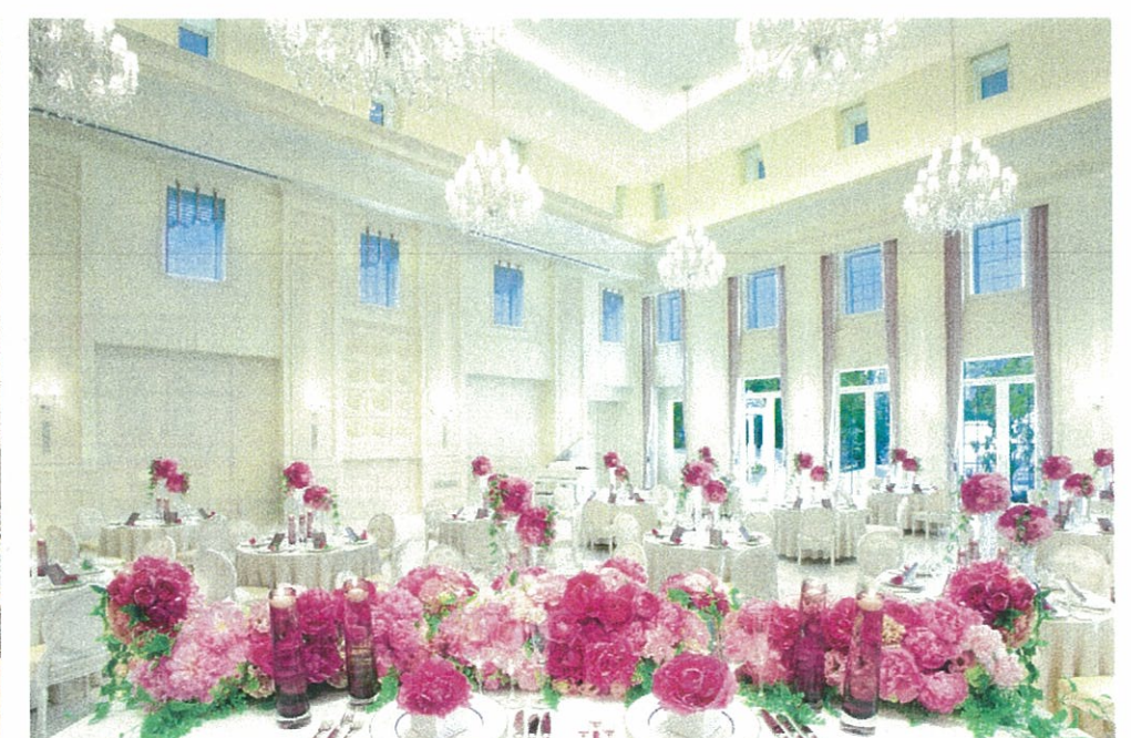
モナコのゴージャスな邸宅をイメージ