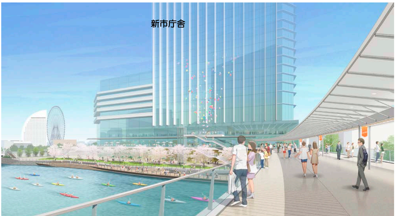
② 大岡川左岸側より北仲通地区方面を望む