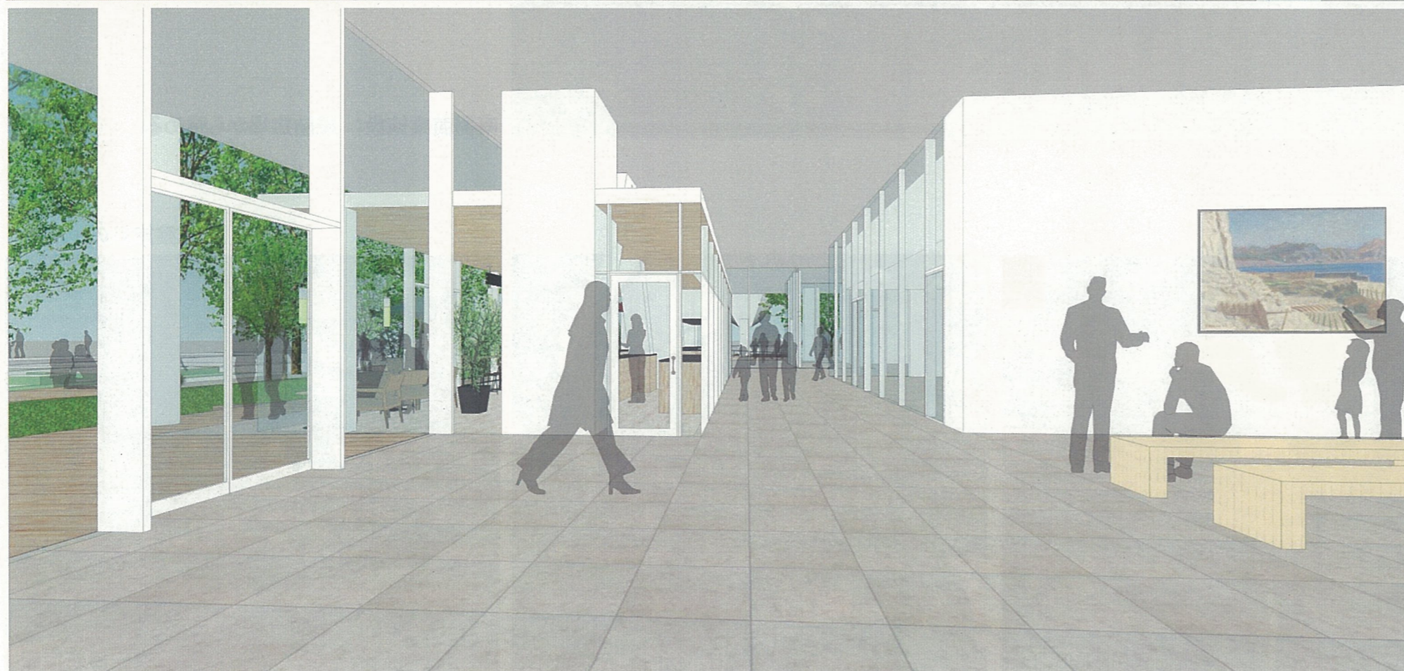
展示スペース： 橋詰広場方面を眺める