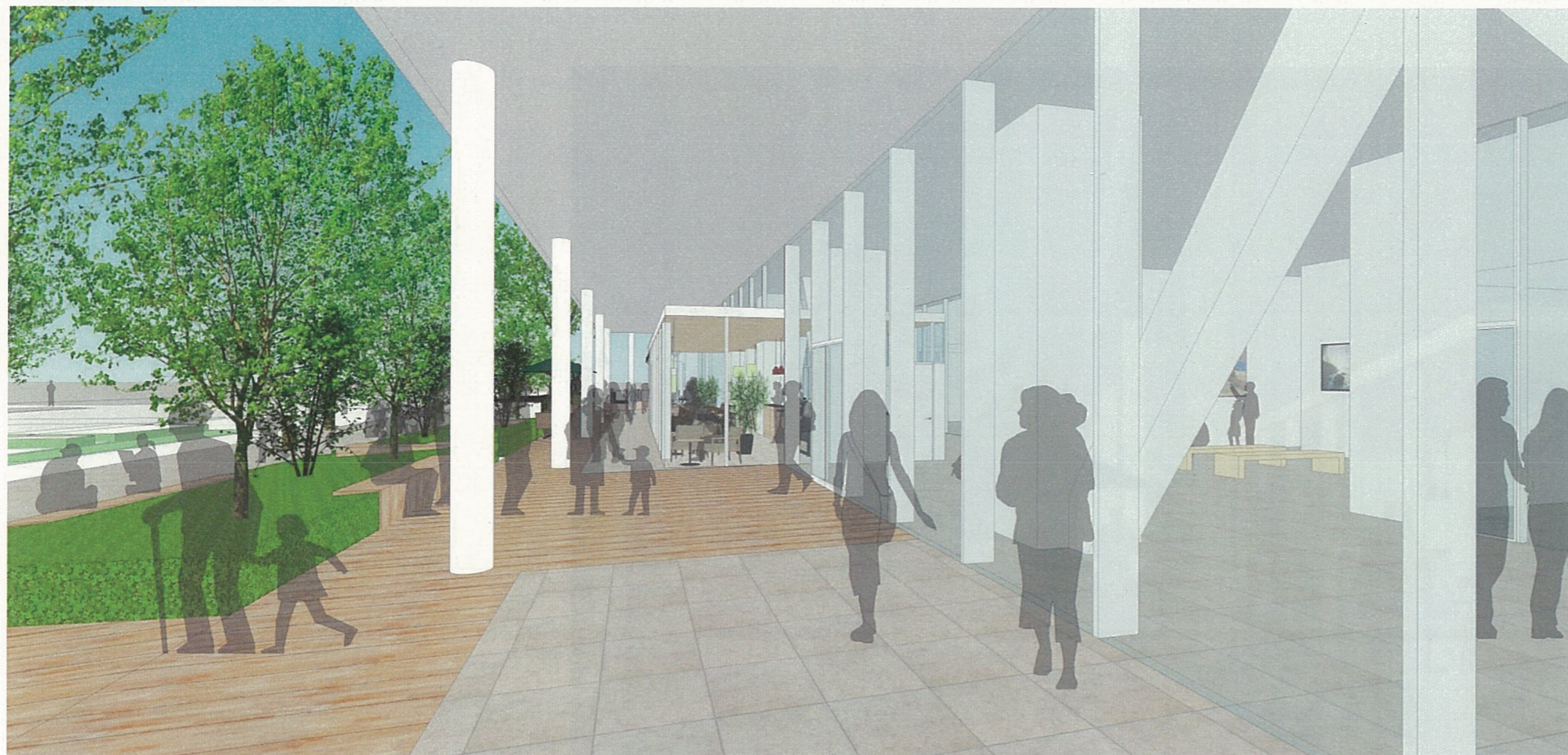
ピロティ： 橋詰広場方面を眺める