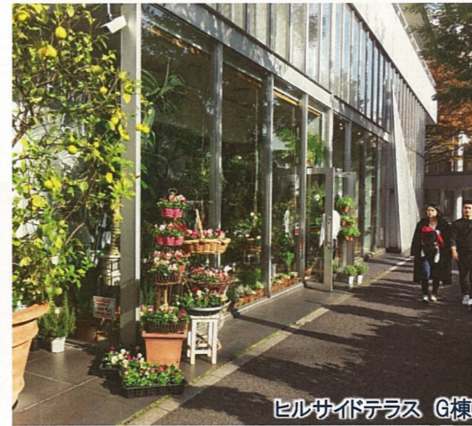
ヒルサイドテラス G棟