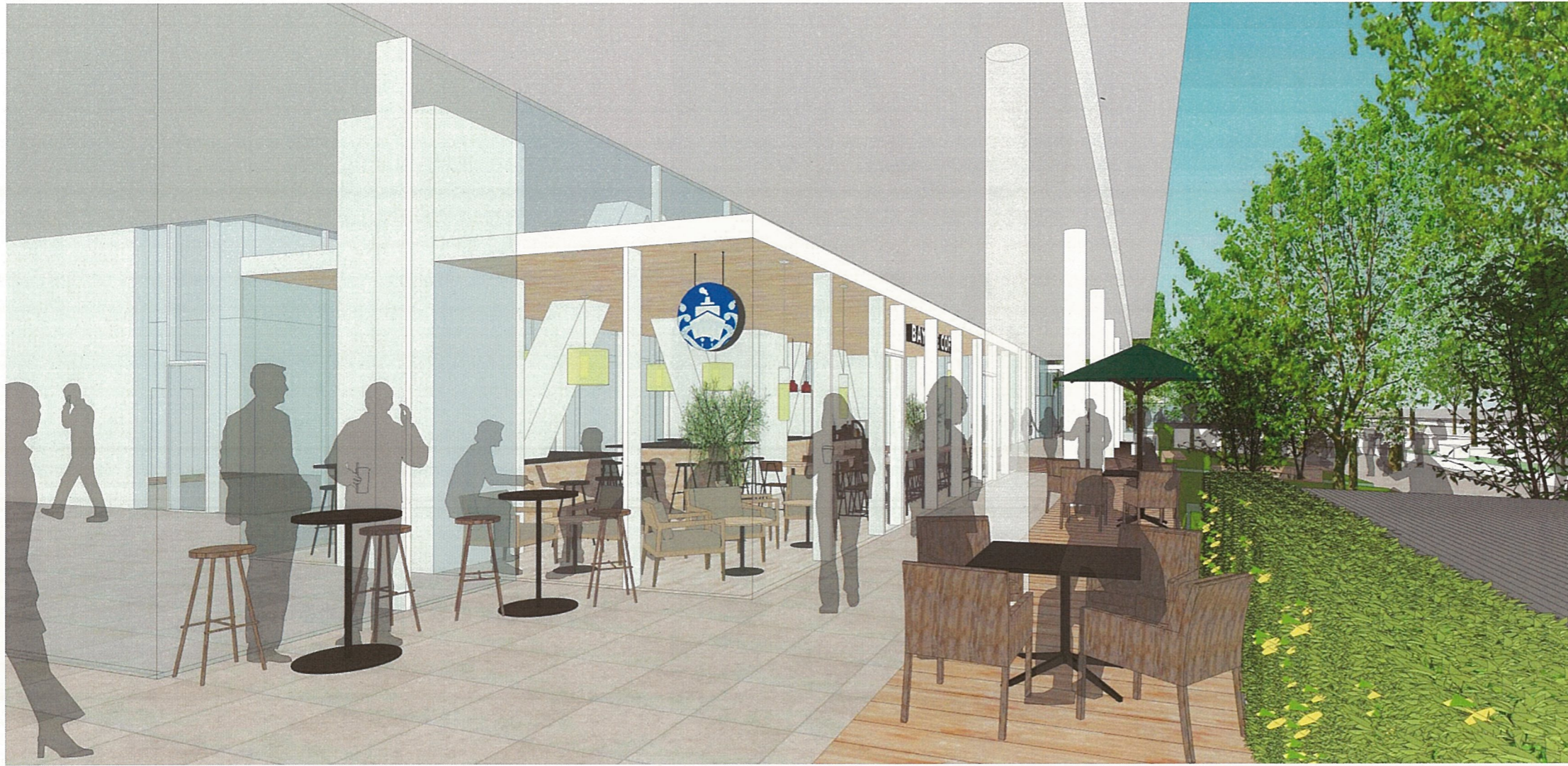
南側商業施設：橋詰広場から眺める