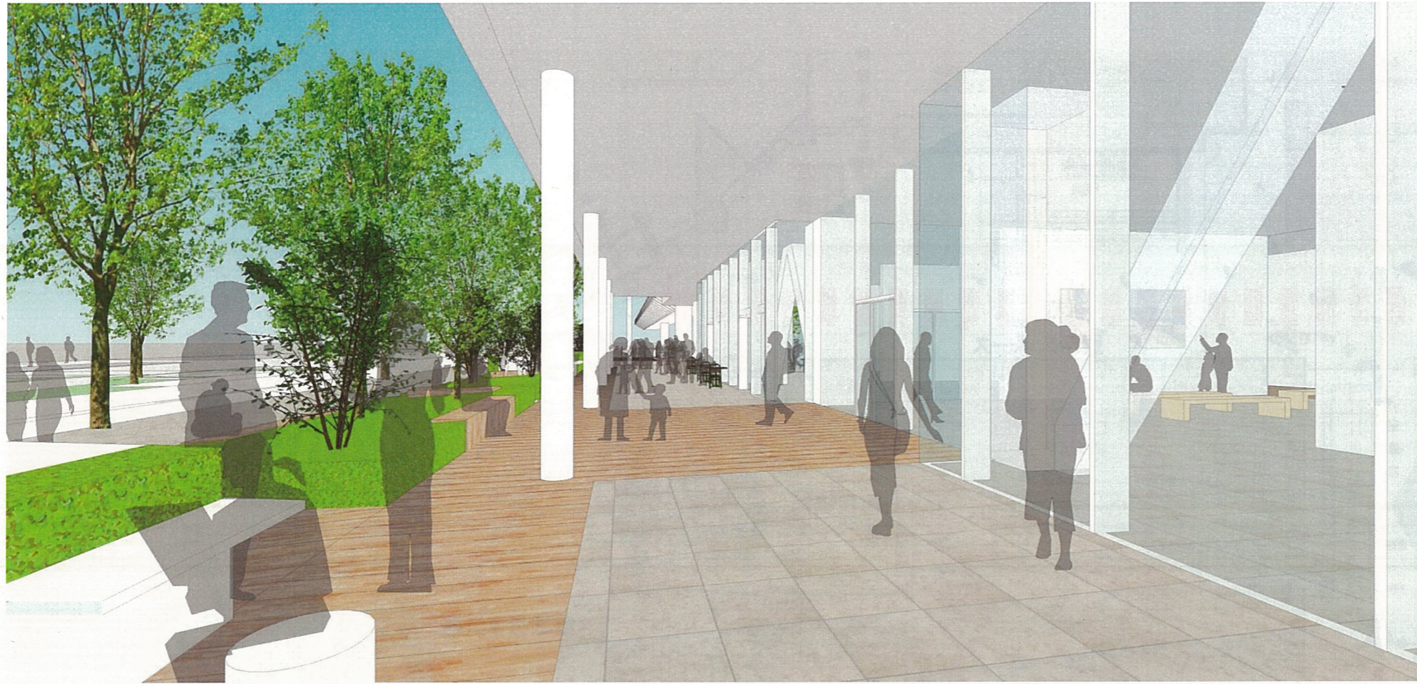
ピロティ: 橋詰広場方面を眺める