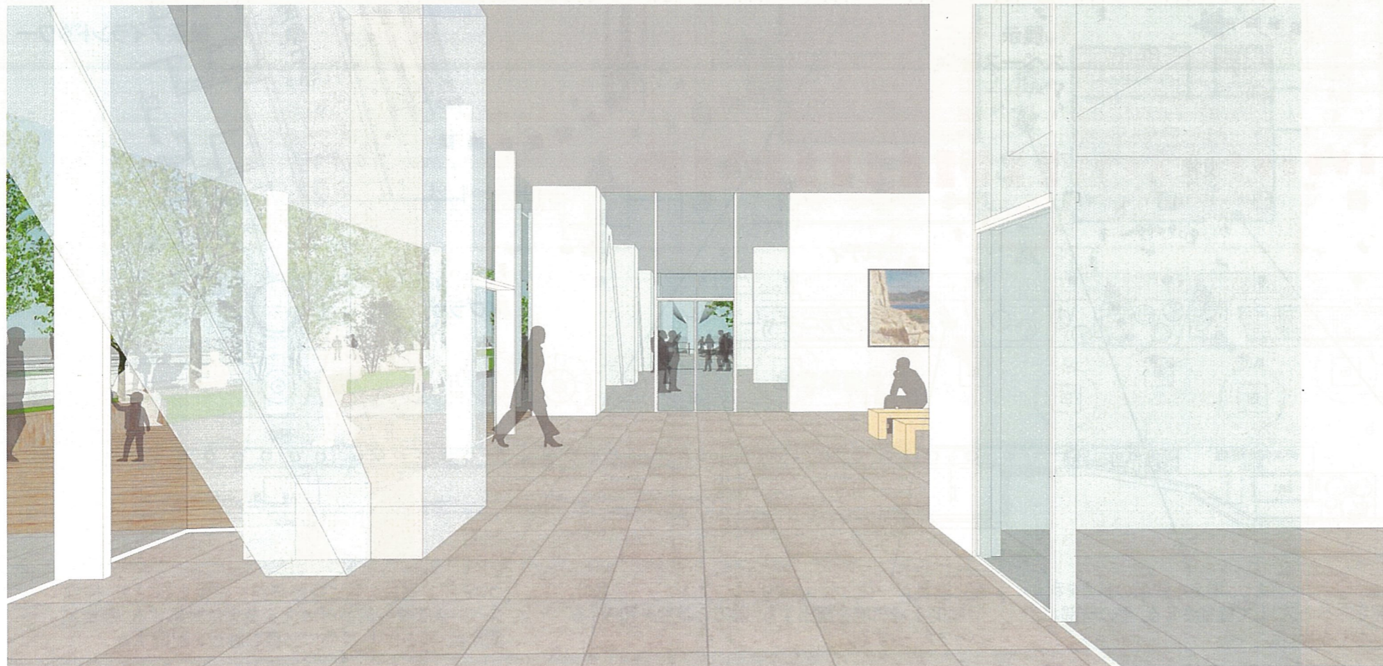
展示スペース: 橋詰広場方面を眺める(商業施設を介して)