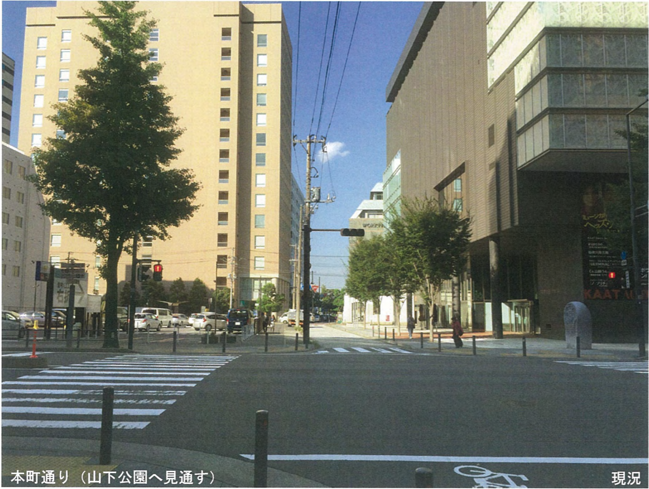
本町通り (山下公園へ見通す)