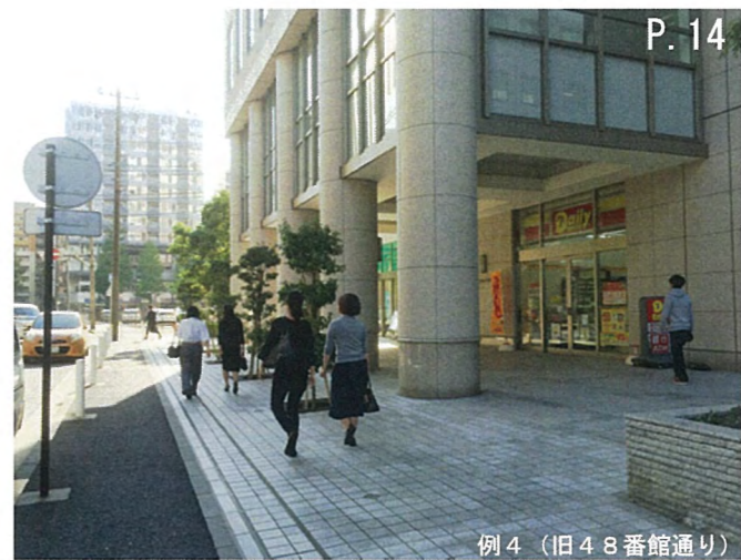
例 4 (旧 4 8 番館通り)