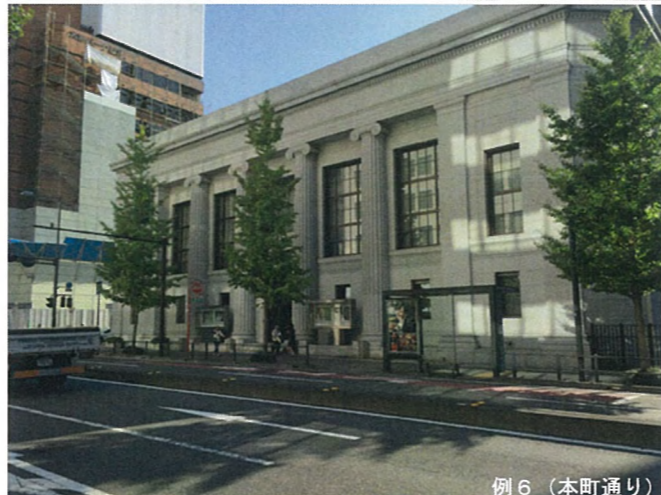
例 6 (本町通り)