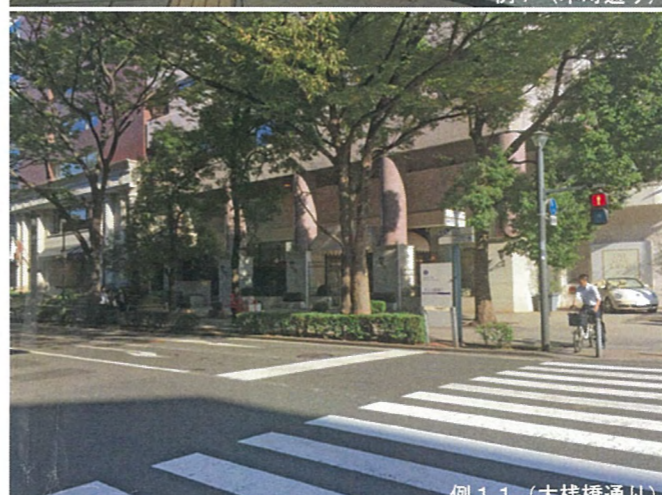
例 11 (大槓橋通り)