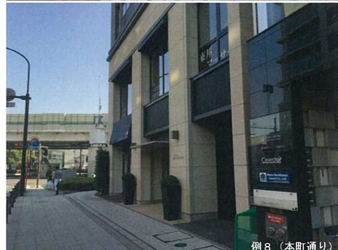
例 8 (本町通り)