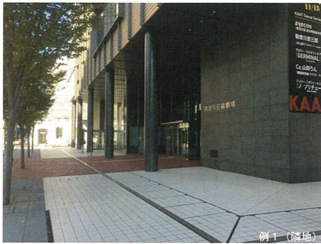
例 1 (隣地)