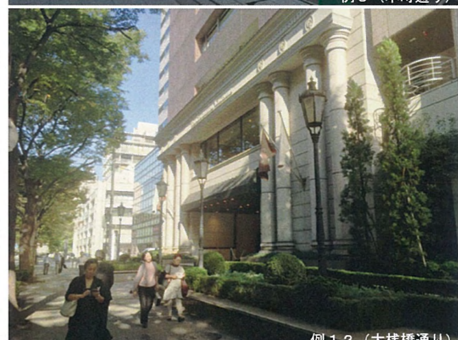
例 12 (大槓橋通り)