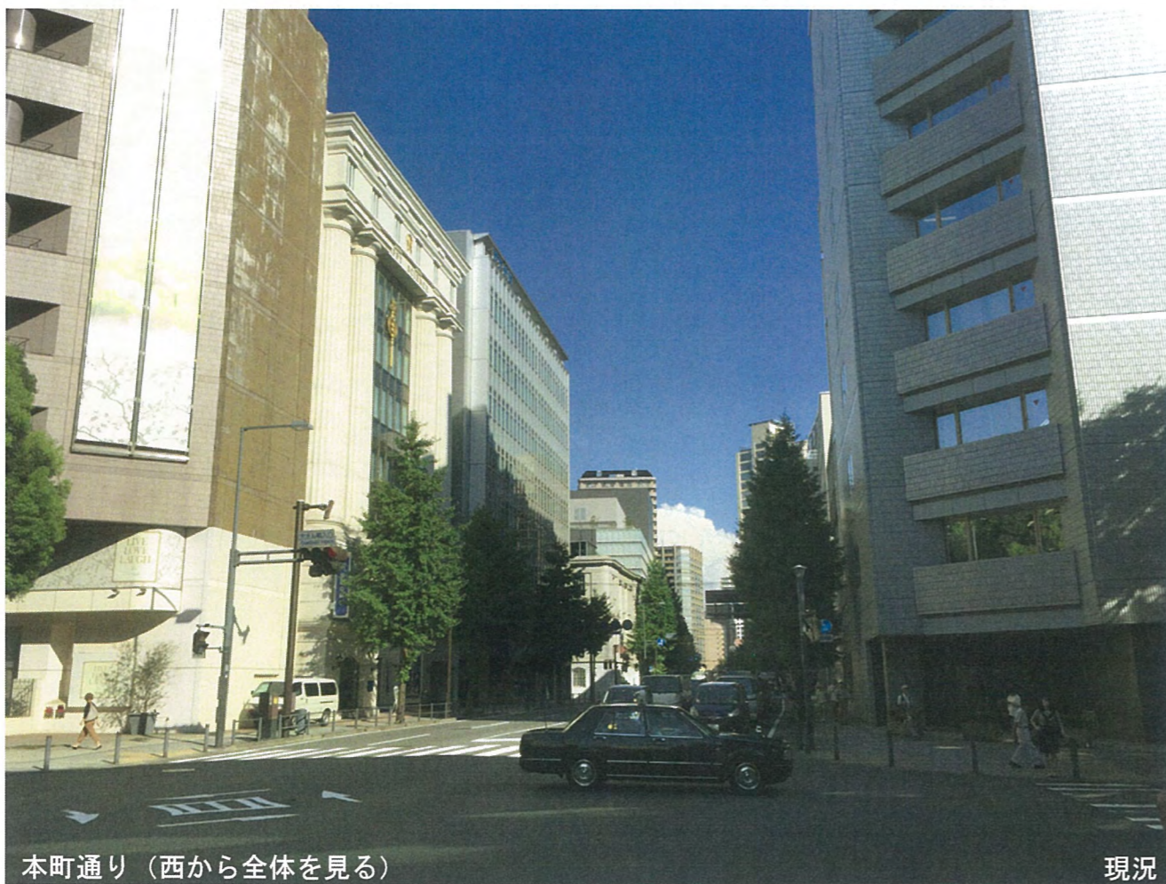
本町通り (西から全体を見る)