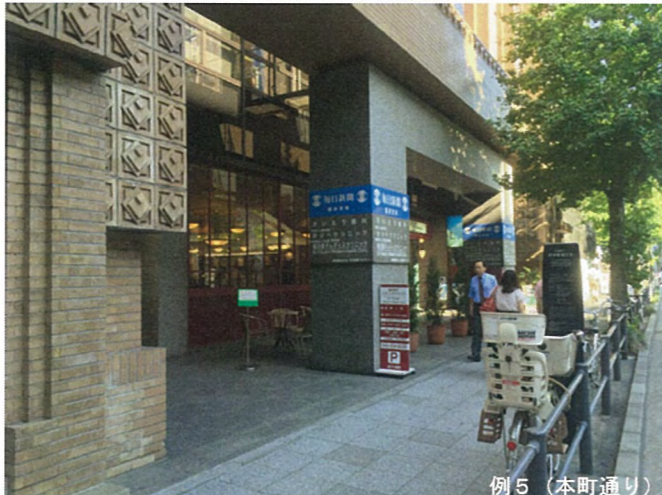
例 5 (本町通り)