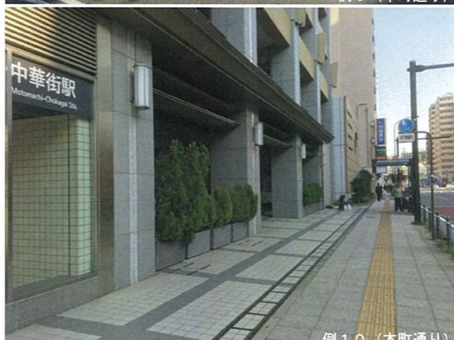
例 10 (本町通り)