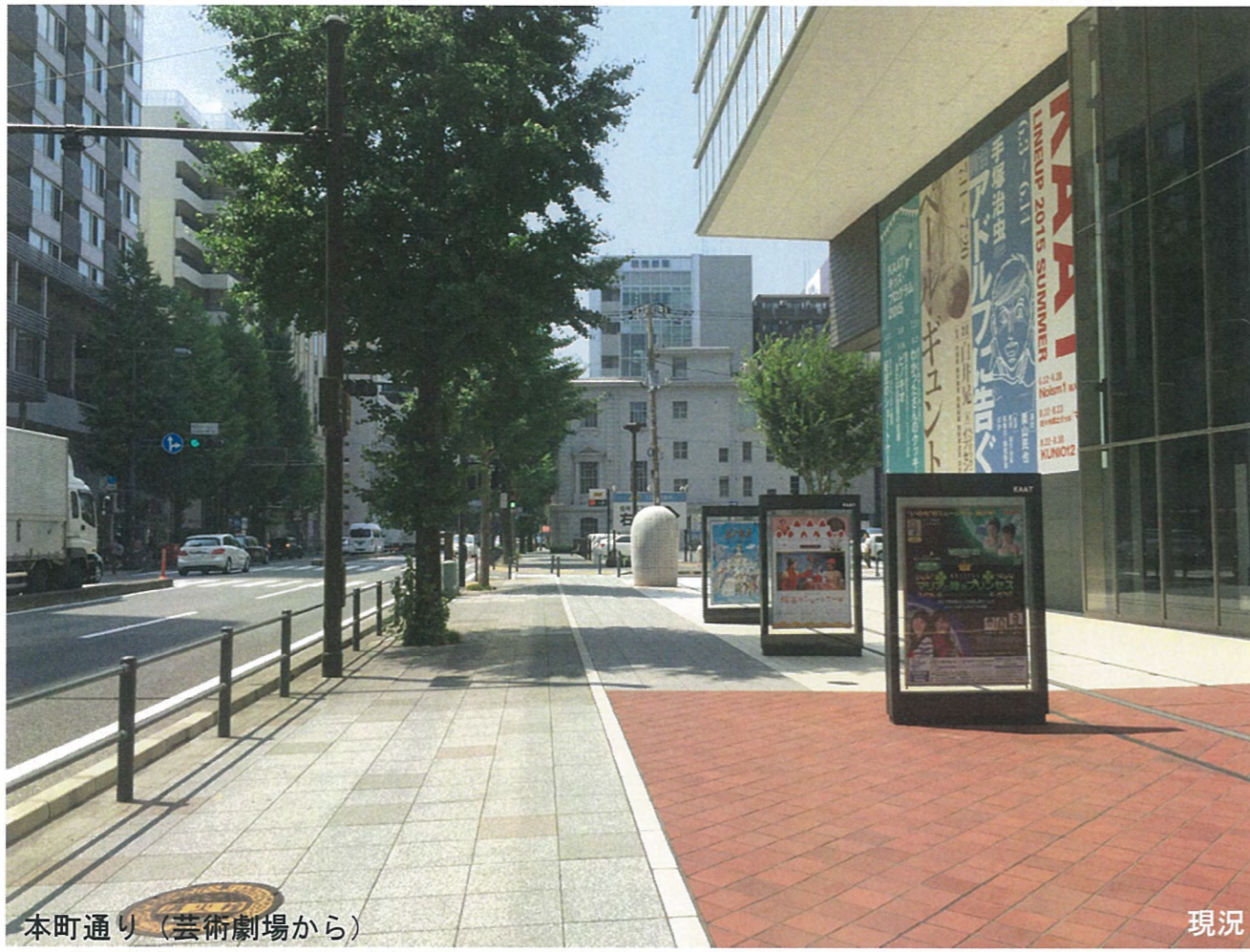
本町通り (芸術劇場から)