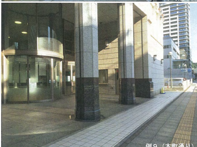
例 9 (本町通り)