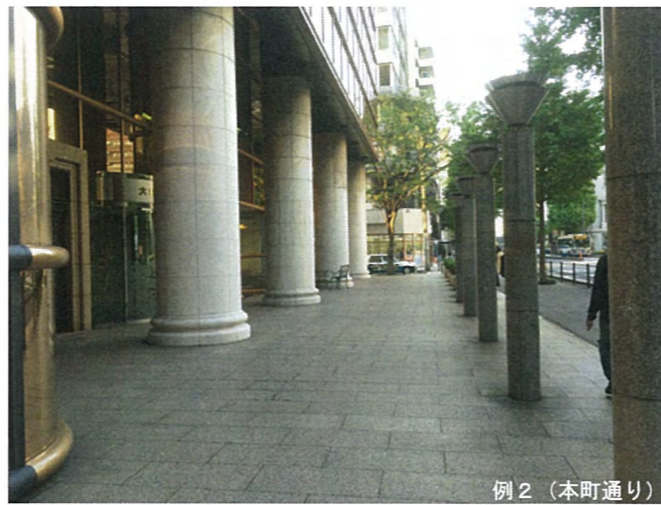
例 2 (本町通り)