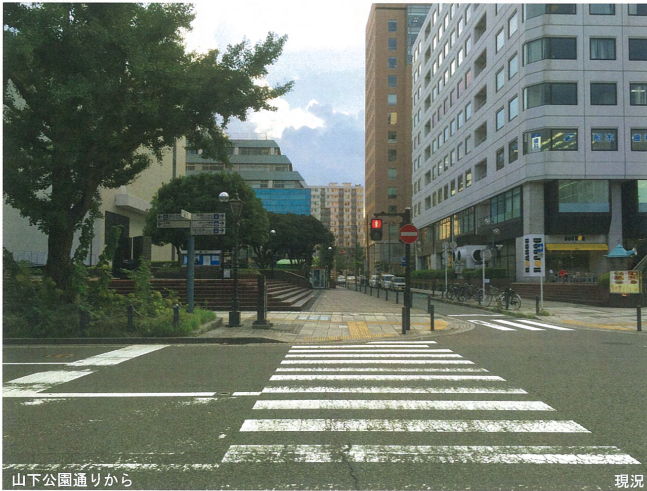
山下公園通りから