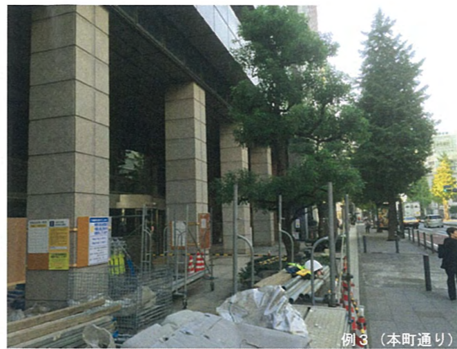
例 3 (本町通り)