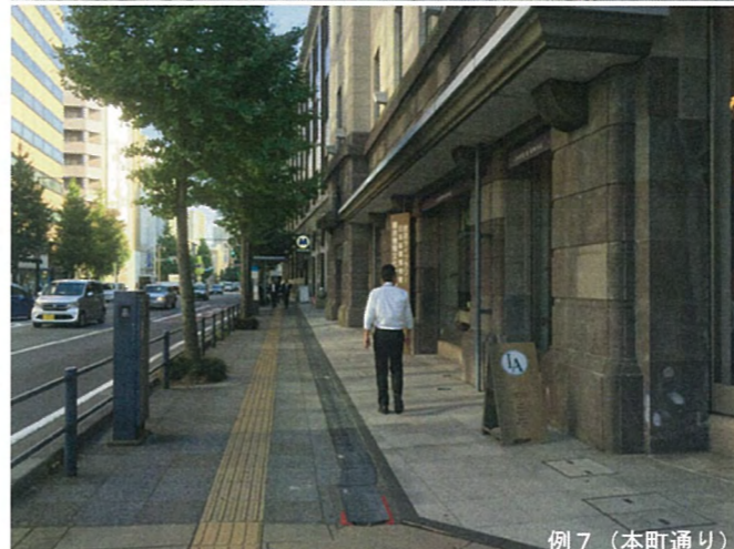
例 7 (本町通り)