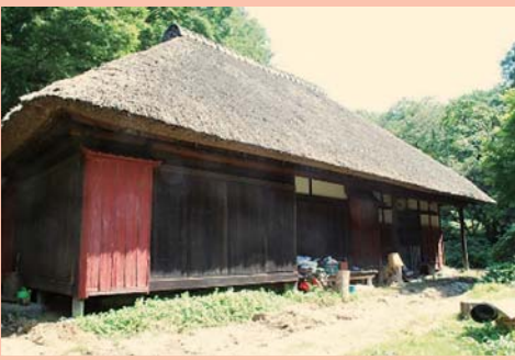
旧藤本家住宅主屋及び東屋