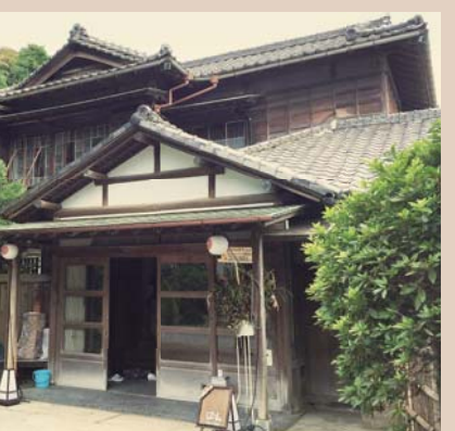
「金沢園」玄関 カフェ&ダイニング「はたん」 http://www.casaco.jp/

このことにより、もともと割烹旅館として多くの宿泊客を受け入れていたという建物の履歴を尊重するとともに、より多くの方々にその歴史が知られ、利用されることが期待される。