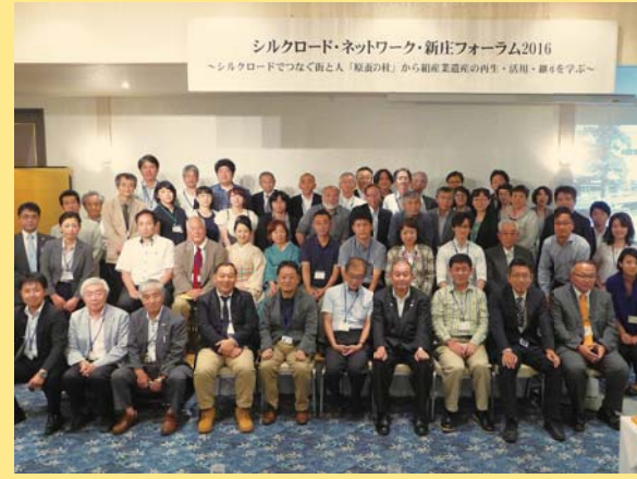
ニュージーランドホテル新庄での集合写真

や観光資源として積極的に保存・活用。当日は、秋田県小坂町、横手市、鶴岡市、福島市、前橋市、川越市、入間市、日野市、横浜市他から絹文化を保全する行政や市民団体の皆様約50名が参加。来年は、福島市で開催。