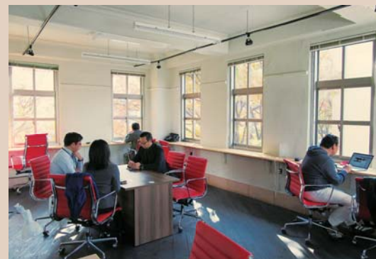
「ジャパンエクスプレスビル」内部の活用(3階) レンタルイベントスペース&コワーキング イノベーション ビア・ワン http://www.innovationpier.jp/

また、4月からは3階に「レンタルイベントスペース&コワーキング イノベーション ビア・ワン」が新たにオープンするなど、歴史的建造物の積極的な活用がなされている。