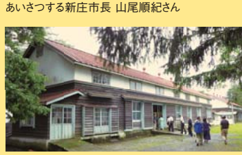
蚕糸試験場を交流拠点として再生「原蚕の社」