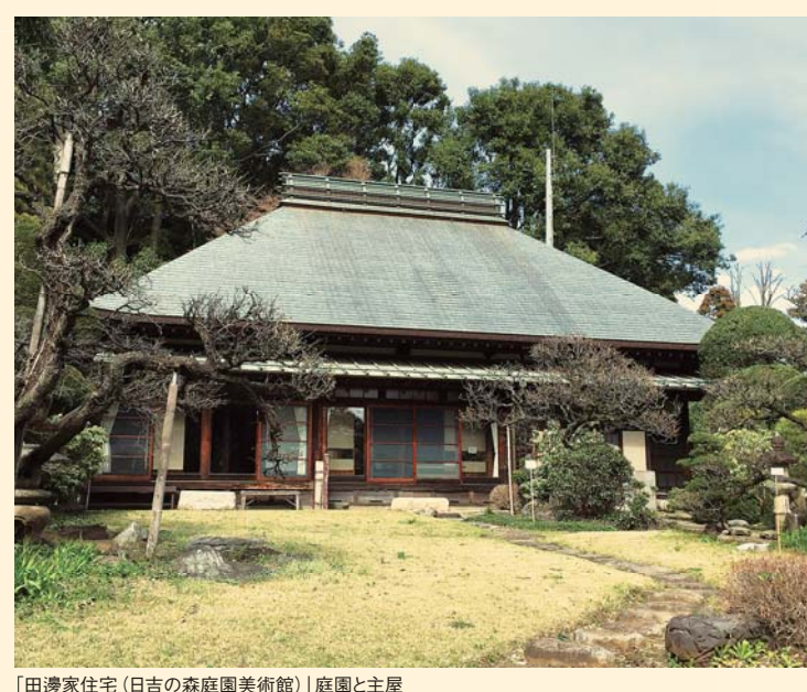
「田邊家住宅(日吉の森庭園美術館)庭園と主屋」