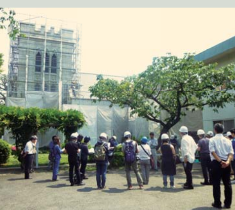
「横浜山手聖公会」大谷石施工現場見学会の様子