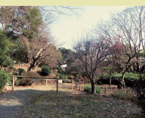
川合玉堂別邸庭園

■庭園公開に関する問合せ 金沢区政推進課企画調整係 電話:045-788-7726