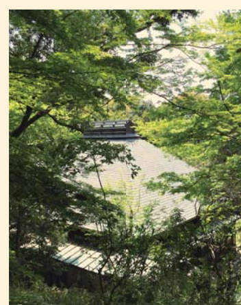
「田邊家住宅(日吉の森庭園美術館)庭園から主屋庭根をみる」

を伝えている。そのため地元小学生が毎年社会科見学で訪れ、かつての農村生活や戦時体験の場としている。