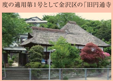
旧円通寺客殿(旧木村家住宅主屋)

平成28(2016)年2月25日に、その制度の適用第1号として金沢区の「旧円通寺