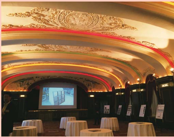
「ホテルニューグランド本館」レインボーボールルーム

横浜を代表するクラシックホテル「ホテルニューグランド」本館の耐震改修工事が完了し、平成28(2016)年10月4日にリニューアルオープンした。横浜市認定歴史的建造物であり、経済産業省の近代化産業遺産にも認定されている本館建物は来年で90周年を迎える。