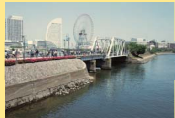
みなとみらい地区を背景に臨港線を活用したプロムナード「汽車道」を見る。

横浜の経済・文化の発展に寄与した鉄道にスポットをあて長年市内の鉄道遺産調査を行ってきた。ブックレット・2の発行を機に開港記念会館でフォーラムを開催。当日は約100名の参加があり盛会。小野田氏の講演で港に網の目のように敷設された鉄道が港湾システムの