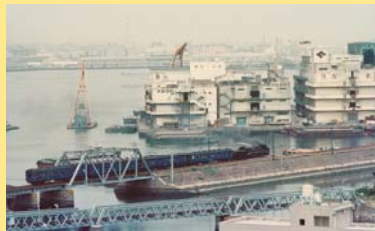
汽車道の現役時代。横浜開港120周年と横浜商工会議所創立100周年記念列車。昭和55(1980)年