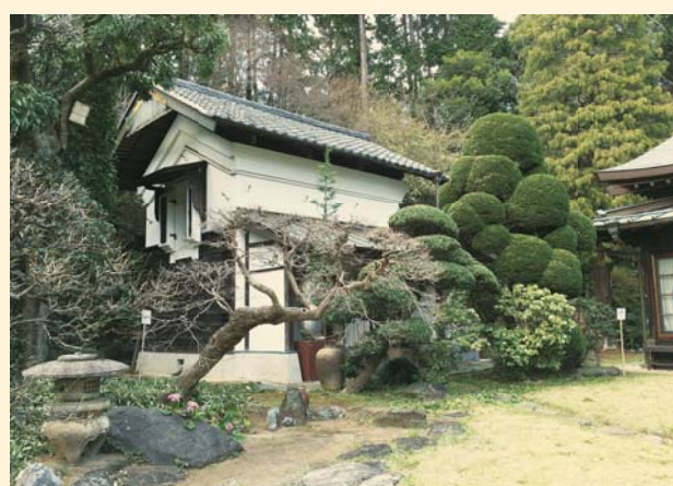
「田邊家住宅(日吉の森庭園美術館)土蔵」

戦中に主屋西側の池を、戦後に主屋南側の池を整備している。ただし、主屋背面・西側面を囲う裏山は、竹藪や雑木林が丘陵の里山風情をよく伝えており、茅葺き主屋(現在銅板覆い)と土蔵にくわえて防空壕跡や古井戸跡などを有し、貴重な歴史的空間