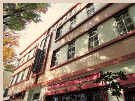
「ジャパンエクスプレスビル」外観

「ジャパンエクスプレスビル」(中区海岸通)の外壁が美しく甦った。平成28(2016)年1月から3月にかけて、劣化が進んでいた外壁の二丁掛タイルをピンニング等で改修するとともに、高圧洗浄をかけ、JAPAN EXPRESSの文字もつくり直すことで、往時の雰囲気を残しつつ、美しい姿をとり戻した。