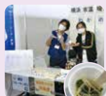
わかめともやしのナムル

海を中心に暮らしを考え、行動のきっかけづくりをするためのイベント。令和4年度は、横浜産のわかめを食べる試食会を行ったよ。