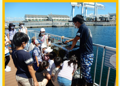
▲前回の実施状況（生きもの観察）