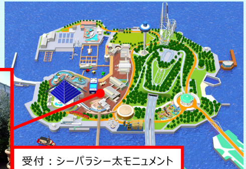
受付：シーパラシー太モニュメント