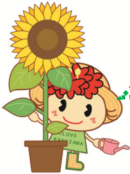
金沢区幸せお届け大使 ぼたんちゃん

横浜・八景島シーパラダイス（金沢区八景島）において、小・中学生を対象とした環境啓発イベント「グリーンキッズ 2022・夏～東京湾の生きもの観察ツアー～」を開催します！夏休み期間中に、実際に生きものを採取し、東京湾の環境について小・中学生が学ぶ姿をぜひ取材してください。