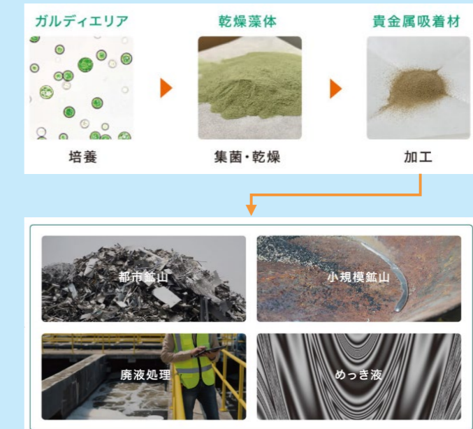
ガルディエリア貴金属吸着剤の製造・利用フロー