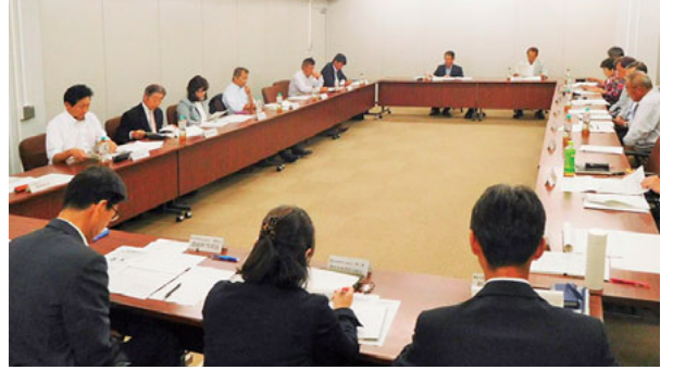
農業委員会連合会での検討の様子

農業委員会連合会では、5月23日に開催した連合会理事会において、両農業委員会で内容を検討した「平成31年度県農地等利用最適化の推進に関する意見」について審議し、11件の意見・要望事項を取りまとめ、県農業会議に提出しました。今後、横浜市に対しても連合会としての意見・要望を提出していく予定です。