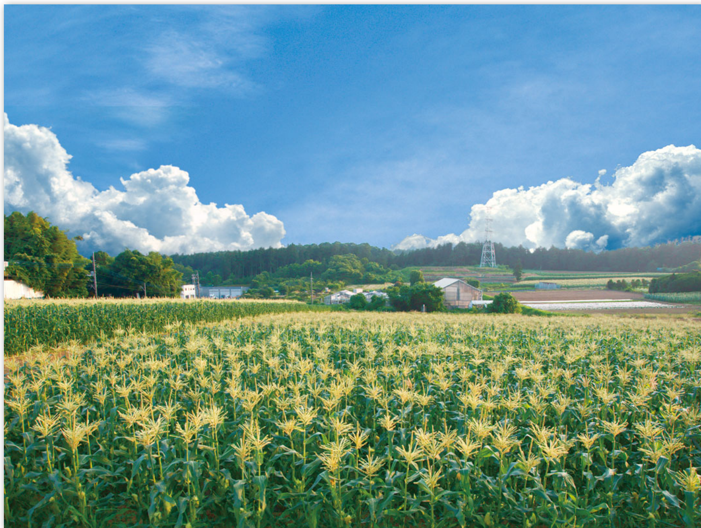
トウモロコシ畑（旭区下川井町）