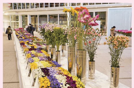
過去の会場の様子