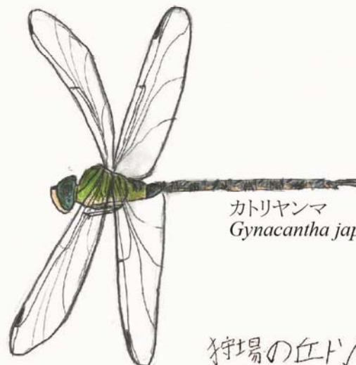
カトリヤノマ Gynacantha japonica