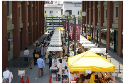
実施会場イメージ