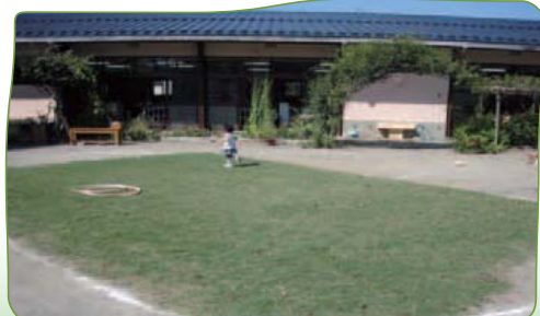
保育園や幼稚園の園庭の芝生化(青葉区)