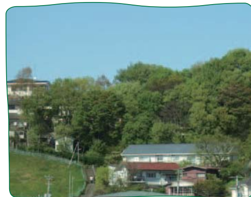
樹林地の保全:上星川地区(保土ヶ谷区)