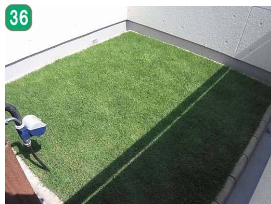
屋上緑化等助成事業（川和町）