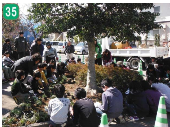
地域緑のまちづくり事業（牛久保西地区）