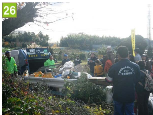
不法投棄対策事業（池辺農業専用地区）