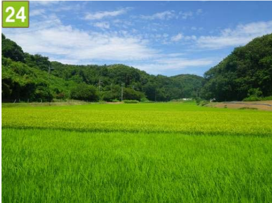
24 水田保全契約奨励事業（恩田町）