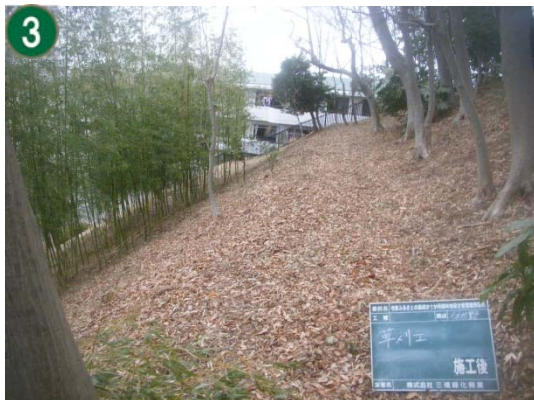
緑地再生等管理事業[市民の森等の手入れや下草刈り]（もえぎ野ふれあいの樹林）