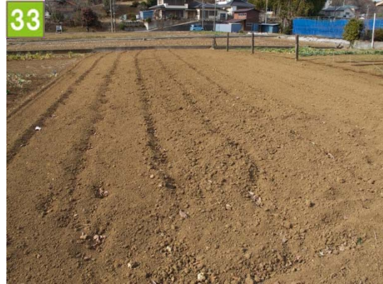
33 農地流動化促進事業（恩田町）