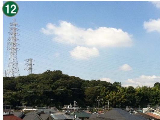
特別緑地保全地区指定等拡充事業 （特別緑地保全地区：大曽根台地区）