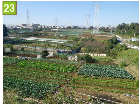
集団的農地の維持管理奨励事業 （新羽大熊農業専用地区協議会）