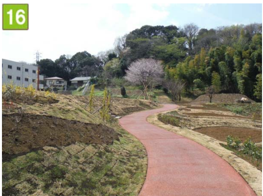
農園付公園整備事業（師岡町）