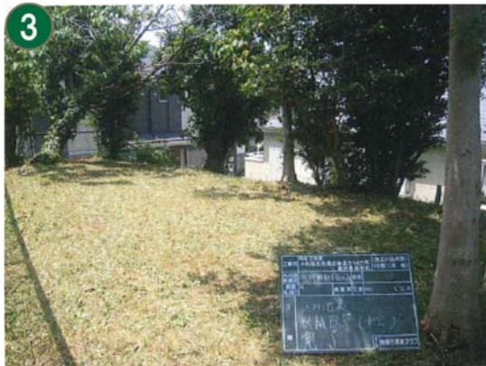
緑地再生等管理事業（熊野神社市民の森）