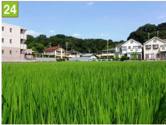
水田保全契約奨励事業（箕輪町三丁目）