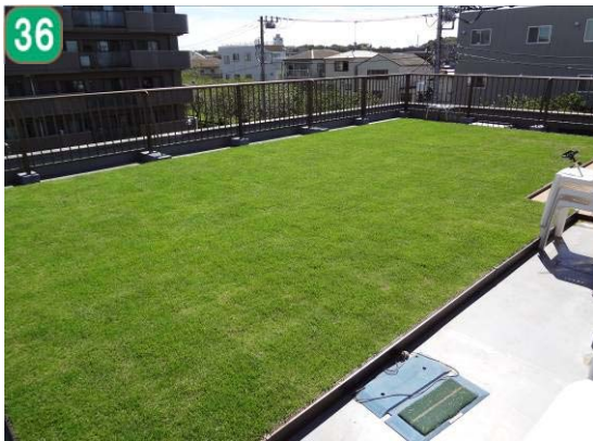
屋上緑化等助成事業（新羽町）