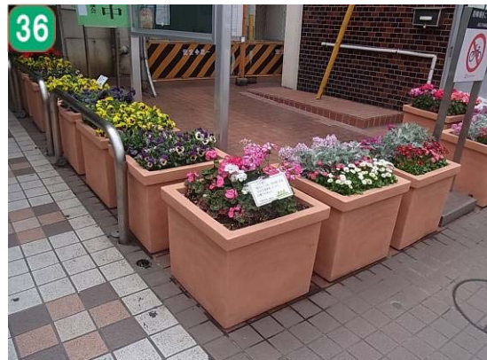
区民花壇事業（東横線菊名駅東口）