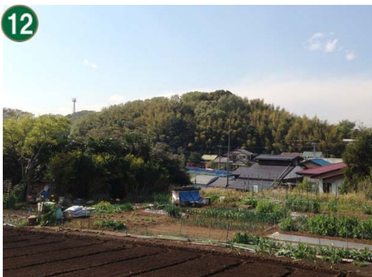
特別緑地保全地区指定等拡充事業 （特別緑地保全地区：新吉田町地区）