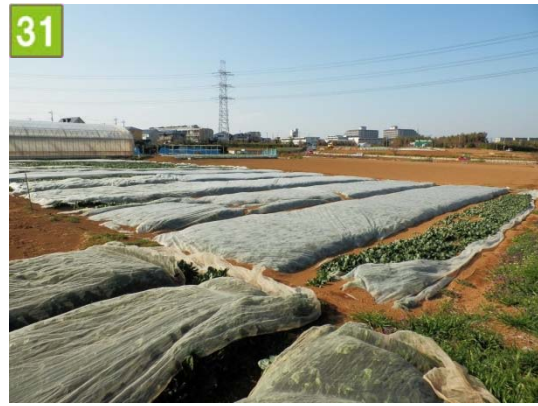
農地貸付促進事業（新羽町）