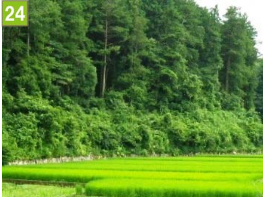
水田保全契約奨励事業（矢指町）