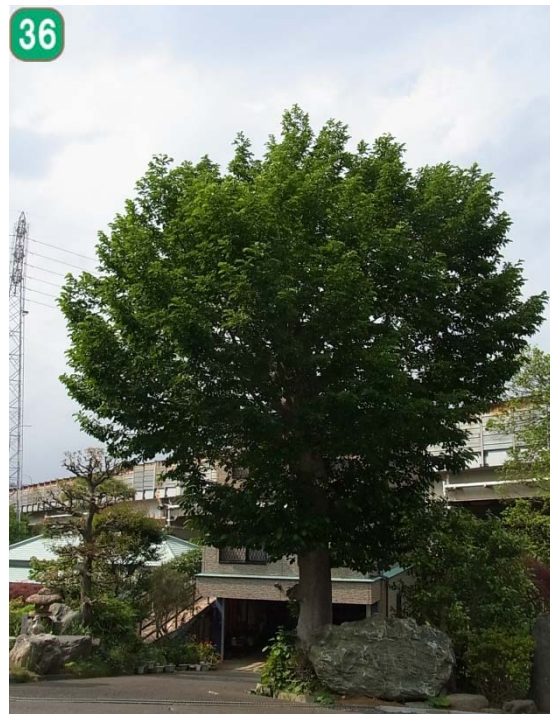
名木古木保存事業（本宿町）