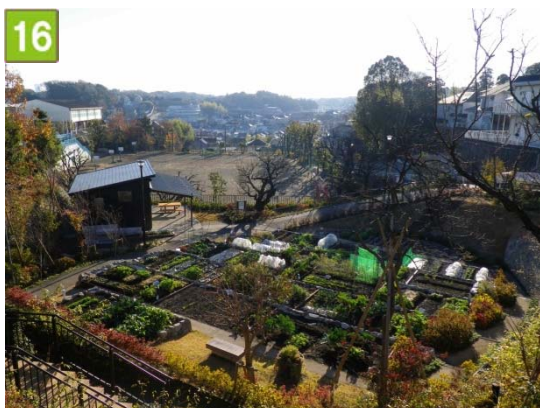
農園付公園整備事業（南本宿町）