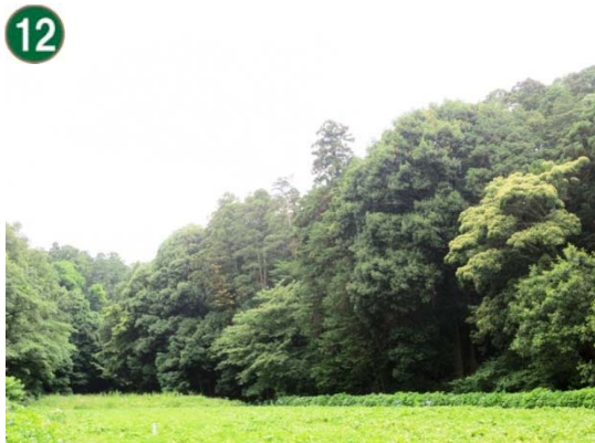
特別緑地保全地区指定等拡充事業 （特別緑地保全地区：追分地区）