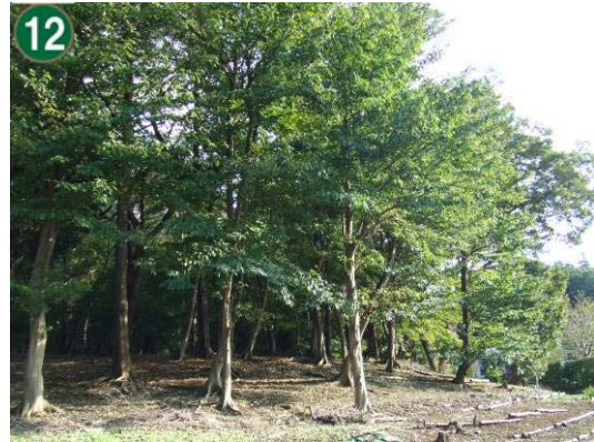
特別緑地保全地区指定等拡充事業 （特別緑地保全地区：上川井町堀谷地区）