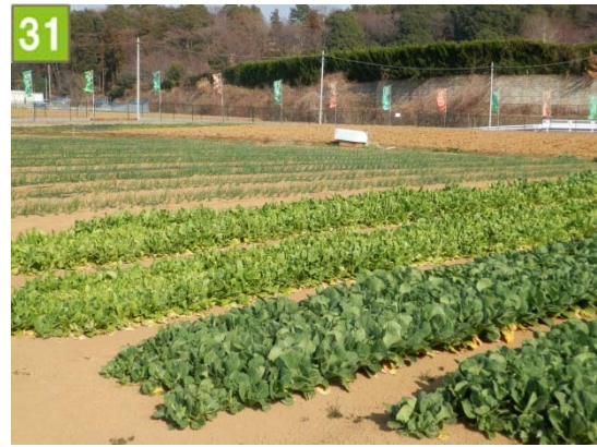
農地貸付促進事業（上川井町）