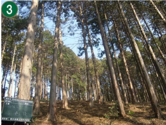
緑地再生等管理事業[市民の森等の手入れや下草刈り]（今宿市民の森）