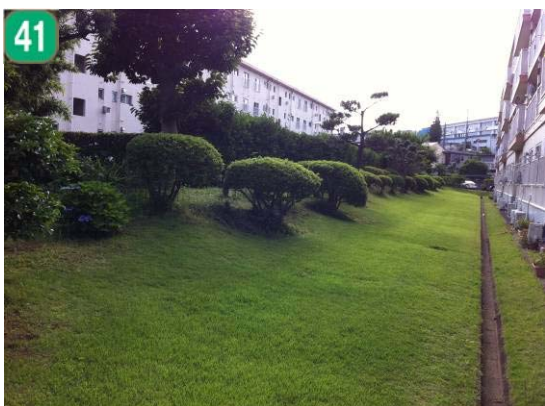
建築物緑化保全契約の締結（市沢町）