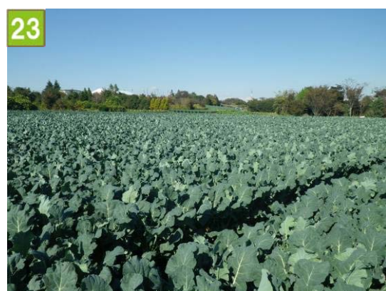
集団的農地の維持管理奨励事業 （上川井農業専用地区協議会）