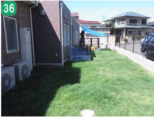
36 保育園・幼稚園芝生化助成事業 （えびちにしゃ園）