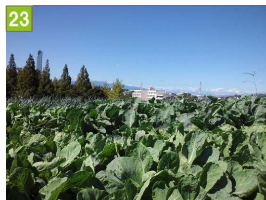
集団的農地の維持管理奨励事業 （西谷農業専用地区協議会）