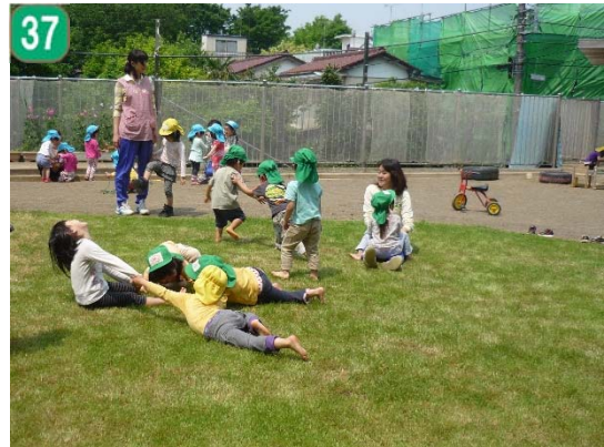
37 公共施設緑化事業[公立保育園の園庭芝 生化]（岩井保育園）