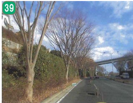
39 いきいき街路樹事業（環状2号線）