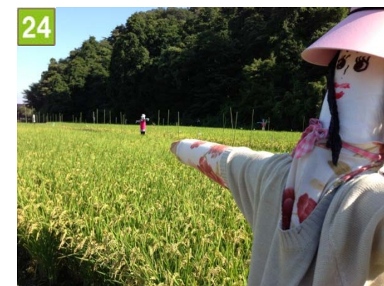
水田保全契約奨励事業（川島町）