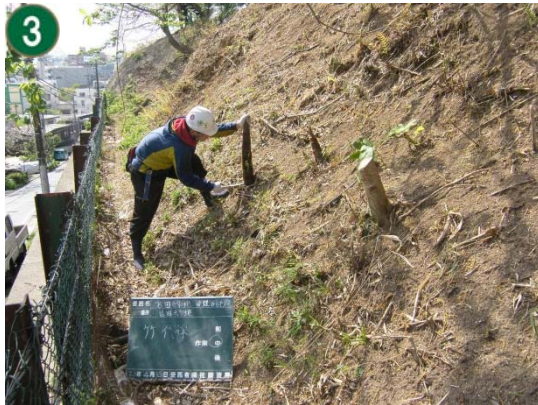
緑地再生等管理事業[市民の森等の手入れや下草刈り]（宮田緑地）