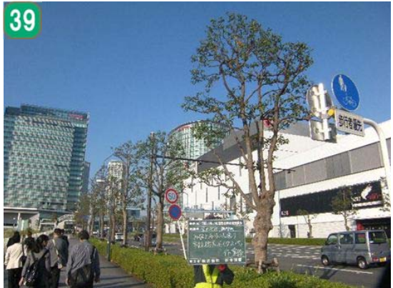
いきいき街路樹事業（施工後）