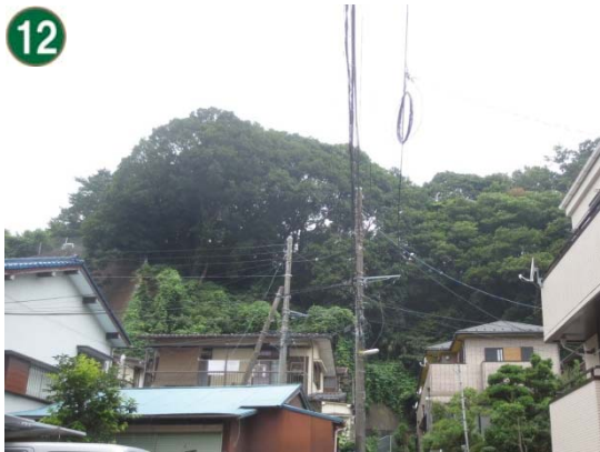
特別緑地保全地区指定等拡充事業 （緑地保存地区）