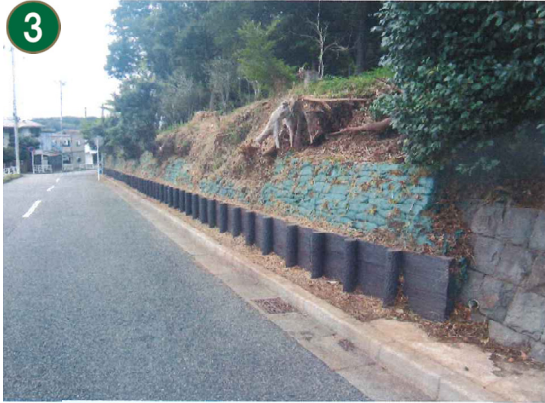
緑地再生管理事業〔市民の森等の斜面地での防災対策工事〕（豊顕寺市民の森）