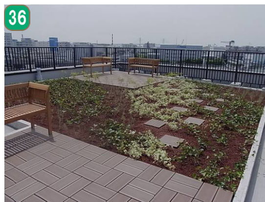
屋上緑化等助成事業（子安通）