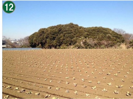
特別緑地保全地区指定等拡充事業 （特別緑地保全地区：三枚町牛道根地区）