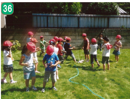
保育園・幼稚園芝生化助成事業 （ニューライフ幼稚園）