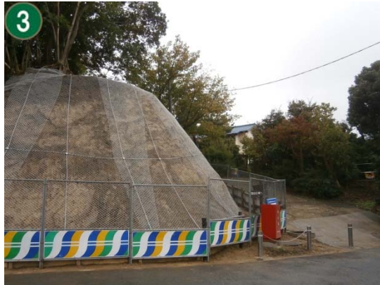
緑地再生等管理事業〔市民の森等の斜面地での防災対策工事〕（獅子ヶ谷市民の森）