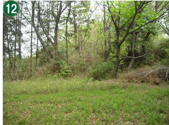
特別緑地保全地区指定等拡充事業 （特別緑地保全地区：北寺尾七丁目地区）