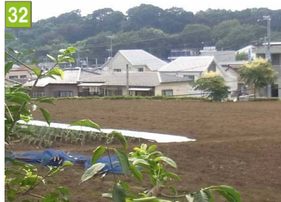
市民農園用地取得事業（東寺尾一丁目）