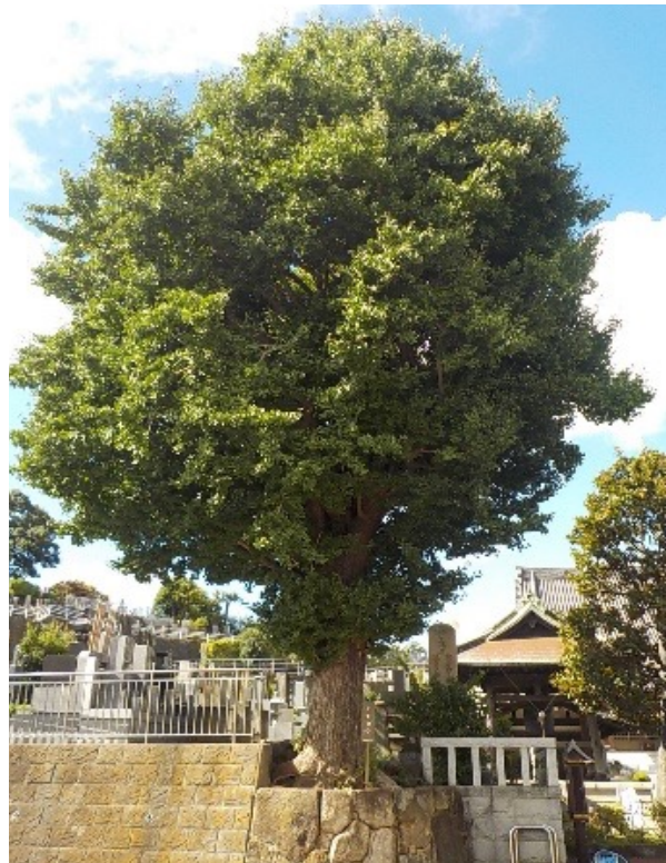
名木古木に指定された樹木

また、指定木の維持管理に必要な樹木の診断や治療及びせん定等の維持管理費用の一部を助成します。