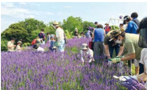
地域で取り組む緑化活動

GREEN×EXPO 2027の開催も見据え、多くの人が訪れる市街地や、生活に身近な住宅地などでの緑や花の創出、育成を進めます。