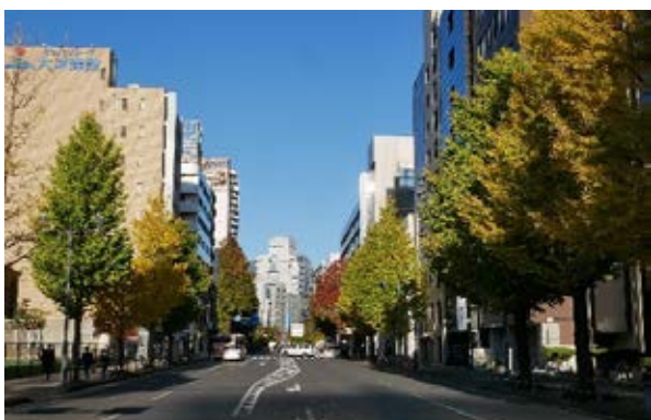
街路樹による良好な景観

駅周辺や各区の主要な路線を中心に、多くの市民の目にふれ、街並みの美観向上に寄与する街路樹を良好に育成します。また、地域で愛されている桜並木等の再生を行います。これらを通して街路樹による良好な景観づくりを進めます。