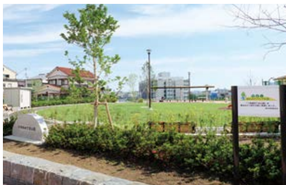
公有地化によるシンボリックな緑の創出・育成

また、花畑や名所など、地域に親しまれている緑のオープンスペースが、所有者の不測の事態等により、存続が困難となる場合に用地を取得し、緑や花による地域のシンボリックな空間として保全し、良好に育成します。