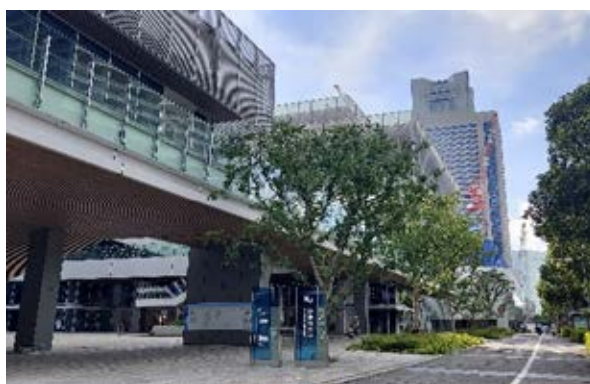
公開性のある場所での緑化

多くの人を訪れる公開性のある民有地において、法令等で定める基準以上の緑化を行う市民・事業者に対し、その費用の一部を助成します。