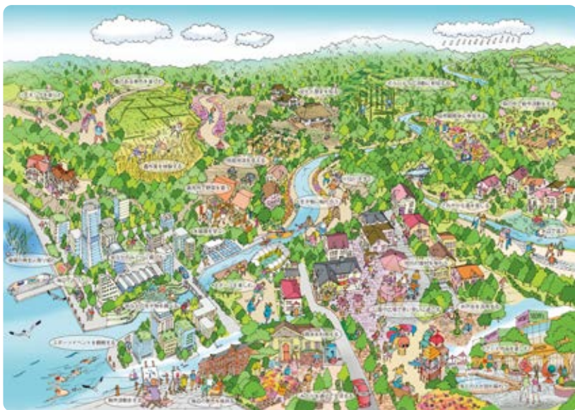
図：水と緑の基本計画の目標像

「拠点となる水と緑、特徴ある水と緑をまもり・つくり・育てます」では、郊外部のまとまりのある樹林地や農地などの緑を「緑の10大拠点」として位置付け、優先的に保全・活用し、次世代に継承するとともに、農によるまちの魅力づくりや、水と緑による都心臨海部の魅力づくりを推進しています。