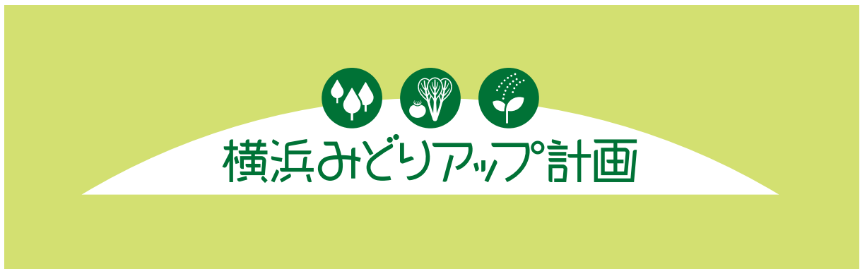
明るい背景色の場合