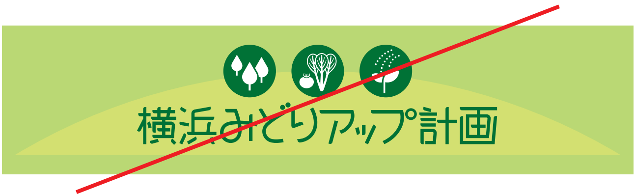
あいまいな背景色