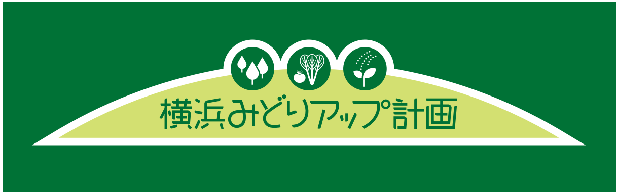
濃い背景色の場合