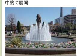
山下公園の緑花(中区)

都心臨海部の緑花による賑わいづくり 都心臨海部において緑や花による空間演出や質の高い維持管理を集中的に展開