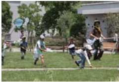
生きもの調査の様子(泉区)

森の楽しみづくり よこはま森の楽校 市内の大学と連携し、多様な環境活動や地域特性を活かした自然体験学習を実施