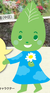
横浜みどりアップのマスコットキャラクター