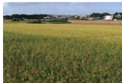
保全された水田(緑区)

市民農園の開設支援 区画貸しの農園や農家の指導を受けられる農園など、市民が栽培から収穫までを楽しめる農園の開設を支援