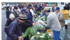
横浜中部地区市民朝市