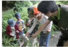
環境学習の様子(瀬谷区)

森の楽しみづくり 森の中のプレイパーク 子どもたちが木とふれあい、遊びを通して森林環境を考える心を育てることの出来るプレイパークを実施