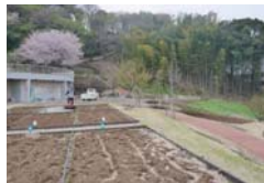
師岡町梅の丘公園(港北区)

農園付公園の整備 継続耕作の困難な農地等を、農的な施設を主とした都市公園として整備