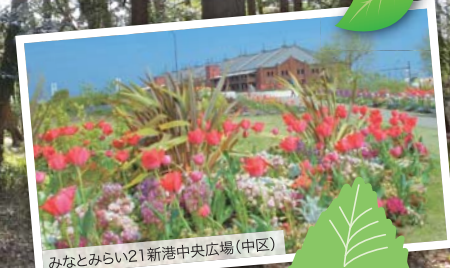
みなとみらい21新港中央広場(中区)