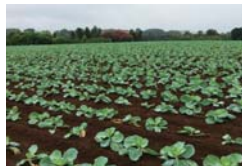
良好に維持されている農地(神奈川区)

農景観を良好に維持する取組の支援 まとまりのある農地を保全し良好な農景観を維持する団体の活動を支援