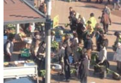
みなとみらい農家朝市(西区)

農園付公園の整備 継続耕作の困難な農地等を、農的な施設を主とした都市公園として整備