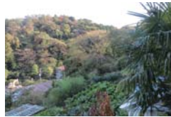
買取り対応した樹林地(磯子区)

不測の事態による買取り希望等への対応 特別緑地保全地区等の指定地で、土地所有者の不測の事態等による買入れ申し出に、着実に対応