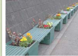
沿道緑化の様子(青葉区)