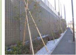
緑化の様子(鶴見区)

保育園・幼稚園・小中学校での緑の創出 子どもを育む空間である、保育園、幼稚園、小中学校において、多様な緑を創出