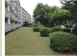
緑化保全契約を締結した緑地(旭区)

建築物緑化保全契約の締結 基準以上の緑化に対し固定資産税等の軽減を図る契約を締結