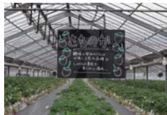
開設支援したイチゴ農園(戸塚区)

収穫体験農園の開設支援 果物のもぎ取りや野菜収穫等、市民が地産地消を体験できる収穫体験農園の整備に対し支援