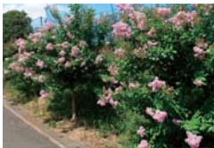
農地縁辺部への農景観植物の植栽(金沢区)

農景観を良好に維持する取組の支援 まとまりのある農地を保全し良好な農景観を維持する団体の活動を支援