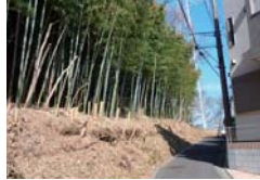
作業実施後の様子(港南区)

指定された樹林地における維持管理の支援 指定した樹林地の外周部などで土地所有者が行う危険・支障樹木の管理作業の支援を実施