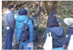
研修の様子(都筑区)

森づくり活動団体への支援 市民の森や都市公園内の樹林地で活動する団体に対して、森づくり活動を支援