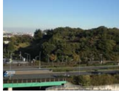
新規指定した樹林地(保土ヶ谷区)

不測の事態による買取り希望等への対応 特別緑地保全地区等の指定地で、土地所有者の不測の事態等による買入れ申し出に、着実に対応