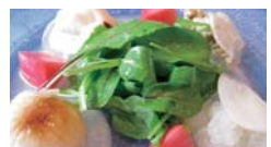
地産地消サポート店のメニュー例 (カブのフルコース)