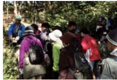
ウォーキングの様子(青葉区)

森の楽しみづくり みどりアップ健康ウォーキング 樹林地保全への関心と理解を深めながら、健康増進を図るウォーキングを実施