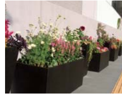
横浜市民ギャラリーの緑化(西区)

公共施設・公有地での緑の創出 各区の主要な公共施設について、緑を充実させる取組を推進