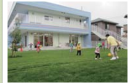
芝生化された園庭(都筑区)

保育園・幼稚園・小中学校での緑の創出 子どもを育む空間である、保育園、幼稚園、小中学校において、多様な緑を創出