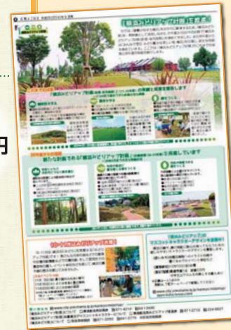
▲広報よこはまの活用