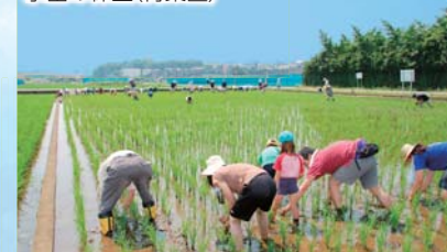
水田の保全(青葉区)