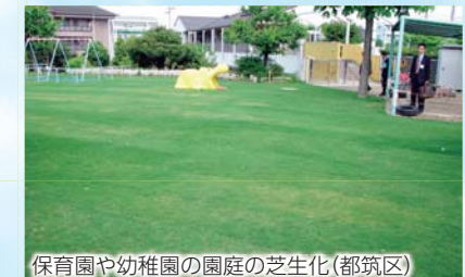
保育園や幼稚園の園庭の芝生化(都筑区)