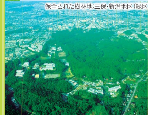
保全された樹林地:三保・新治地区(緑区)

市域の緑の減少に歯止めをかけ、緑豊かなまち横浜を次世代に継承するため、「横浜みどりアップ計画(新規・拡充施策)」を推進しています。