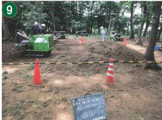
9 間伐材資源循環事業[森づくり団体への 間伐材チップ化作業支援](鯉ヶ久保ふれ あいの樹林)