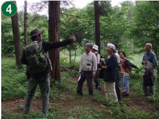
4 市民協働による緑地維持管理事業 （（仮称）新橋市民の森）