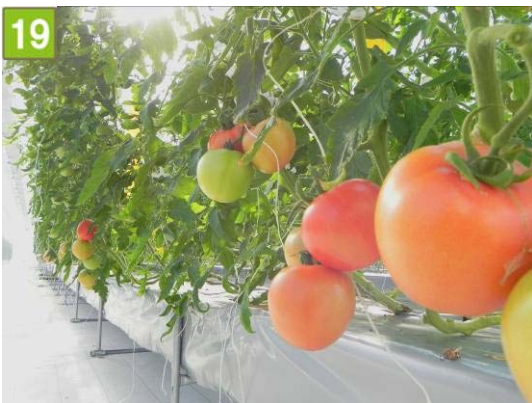
19 収穫体験農園の開設支援事業（和泉町）