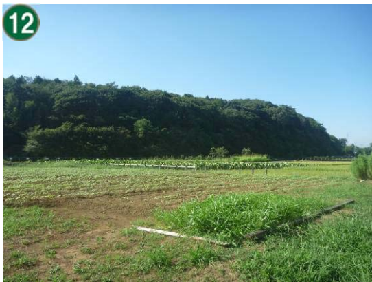
12 特別緑地保全地区指定等拡充事業 （特別緑地保全地区：鍋屋地区）