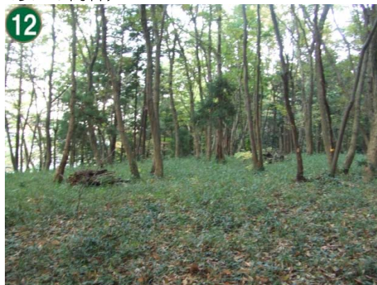
12 特別緑地保全地区指定等拡充事業 （特別緑地保全地区：古橋地区）