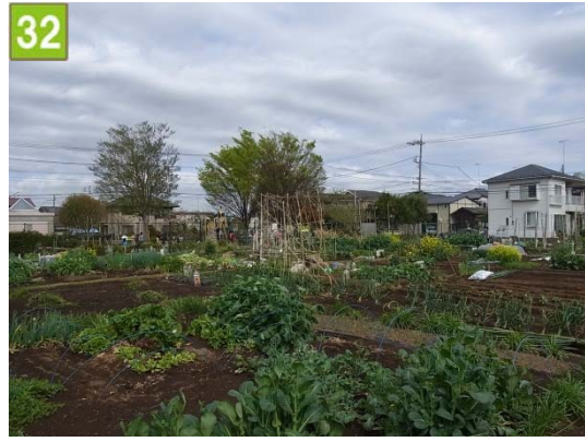
32 市民農園用地取得事業（和泉町）