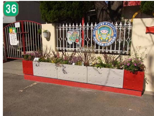
36 区民花壇事業（和泉町）