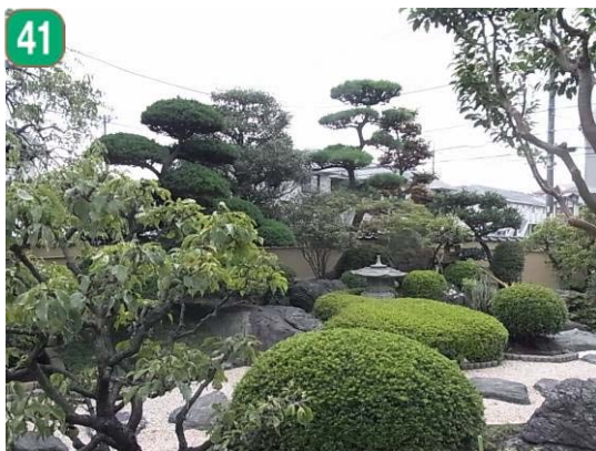
41 建築物緑化保全契約の締結（緑園三丁目）