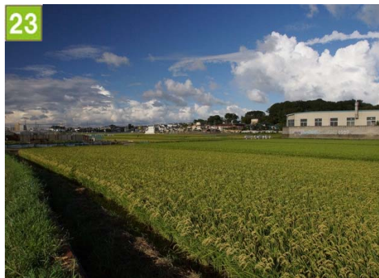
23 集团的農地の維持管理奨励事業 （中下水利組合）