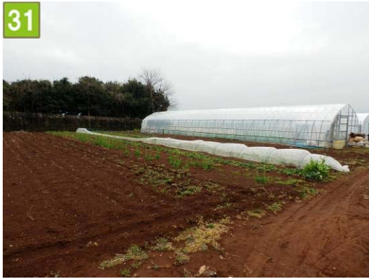
31 農地貸付促進事業（和泉町）