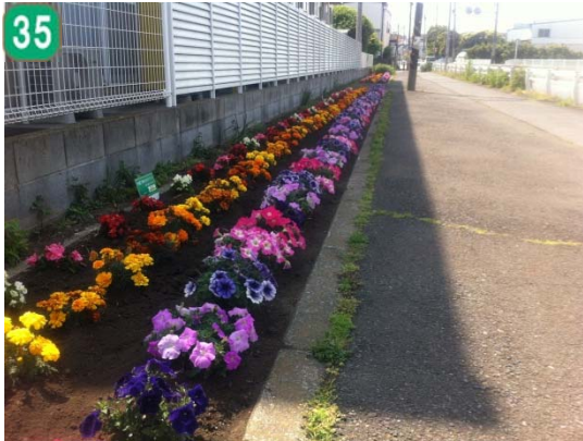
35 地域緑のまちづくり事業[地域緑化計画に基づく緑化整備の実施]（上飯田地区）