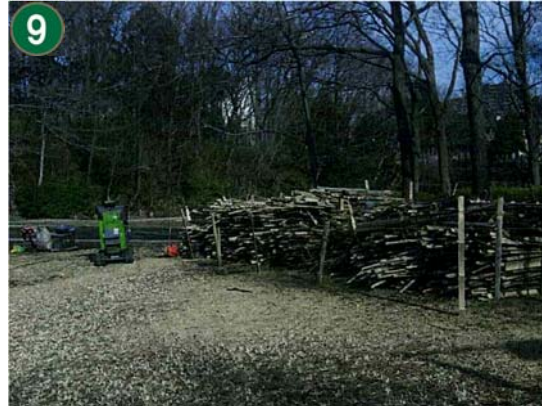
間伐材資源循環事業[森づくり団体への間伐材チップ化作業支援]（茅ヶ崎公園）