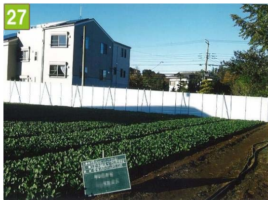
27 環境配慮型施設整備事業[農薬飛散防止ネットの設置]（池辺町）