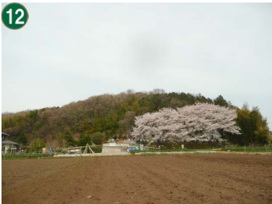
特別緑地保全地区指定等拡充事業 （特別緑地保全地区：川和地区）