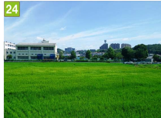
水田保全契約奨励事業（荏田南町）