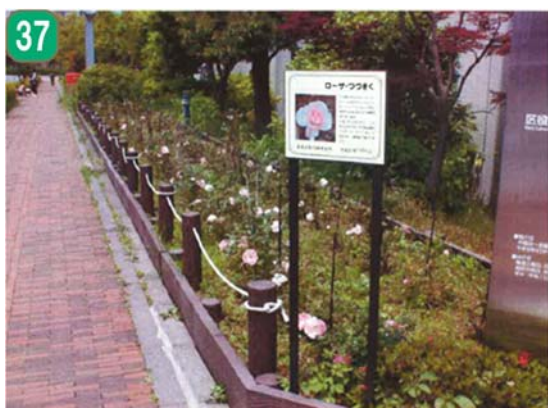
37 公共施設緑化事業（都筑区総合庁舎）