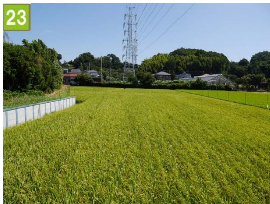
集团的農地の維持管理奨励事業 （大熊下水利組合）