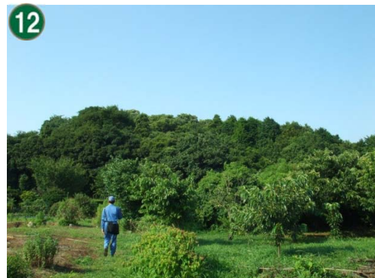
特別緑地保全地区指定等拡充事業 （特別緑地保全地区：池辺町八所谷戸地区）