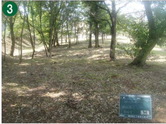
緑地再生等管理事業[市民の森等の手入れや下草刈り]（川和緑地）