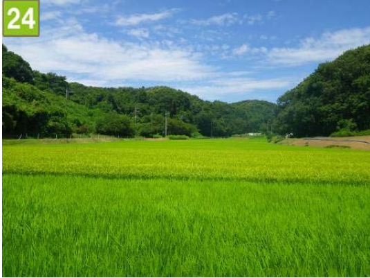
24 水田保全契約奨励事業（恩田町）