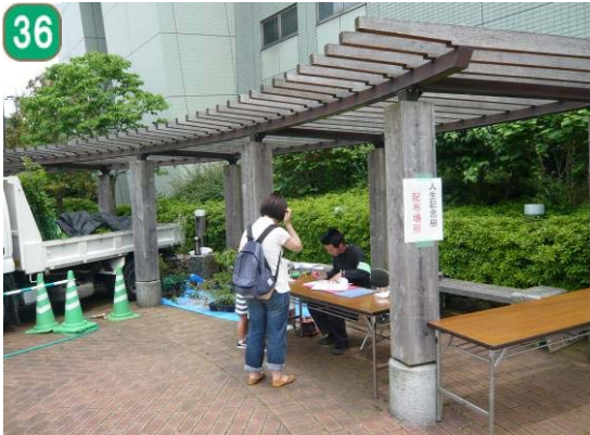
36 記念樹等生産配布事業（人生記念樹の配布）