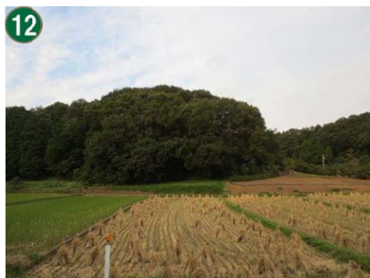
特別緑地保全地区指定等拡充事業 （源流の森保存地区）