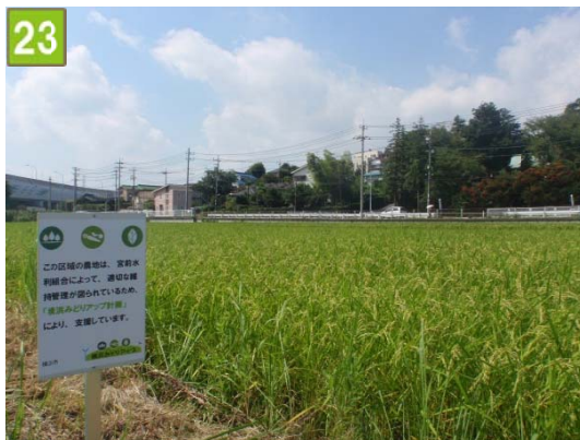
集团的農地の維持管理奨励事業 （宮前水利組合）