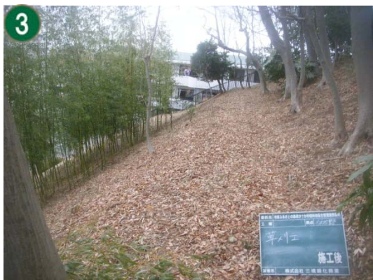
緑地再生等管理事業[市民の森等の手入れや下草刈り]（もえぎ野ふれあいの樹林）