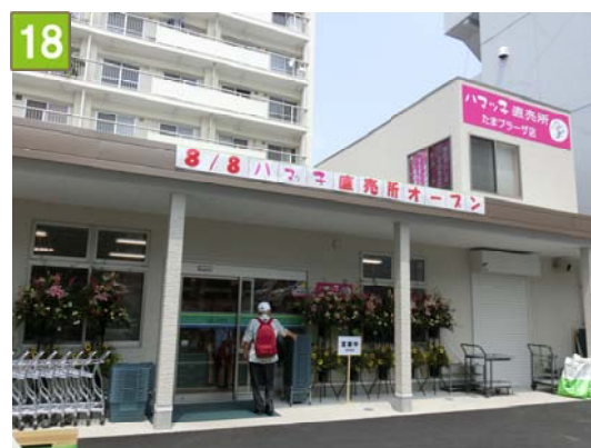
共同直売所の設置支援事業 （ハマっこ直売所 たまプラーザ店）