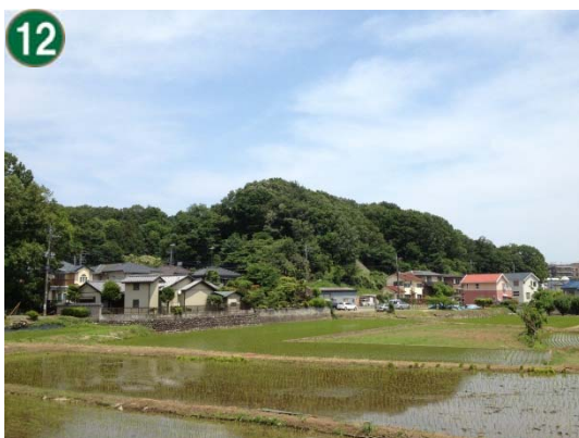
特別緑地保全地区指定等拡充事業 （特別緑地保全地区：恩田東部地区）