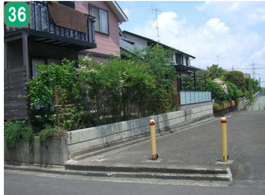
36 生垣設置事業（もみの木台）