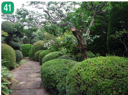
41 建築物の敷地に対する固定資産税等の軽減（個人宅）