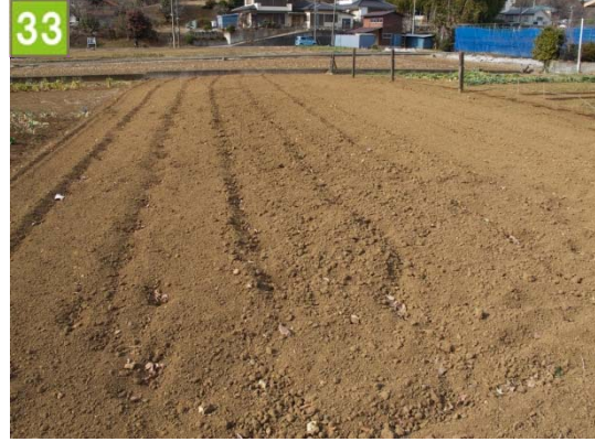
33 農地流動化促進事業（恩田町）