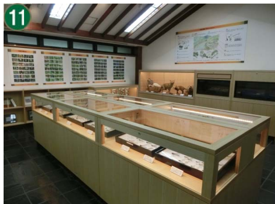
ウェルカムセンター整備事業[展示等の設置]（寺家ふるさと村四季の家）