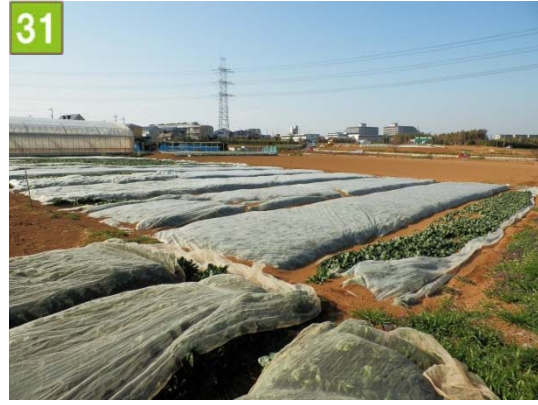
農地貸付促進事業（新羽町）