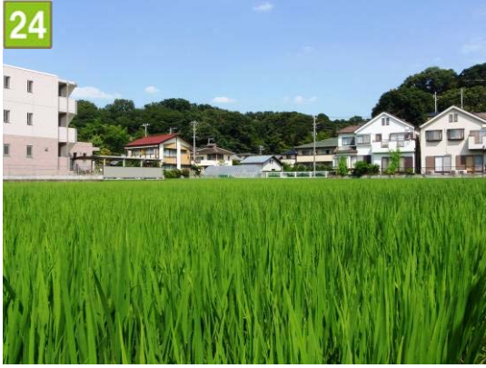
水田保全契約奨励事業（箕輪町三丁目）