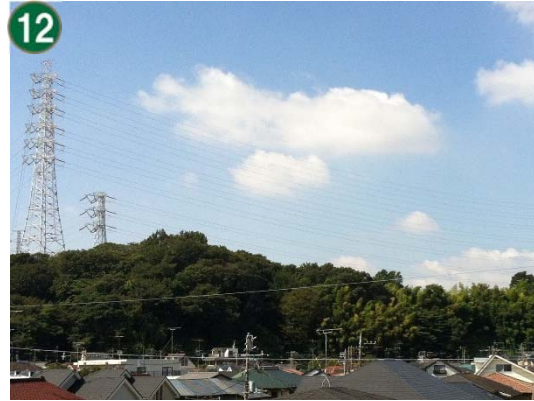
特別緑地保全地区指定等拡充事業 （特別緑地保全地区：大曽根台地区）