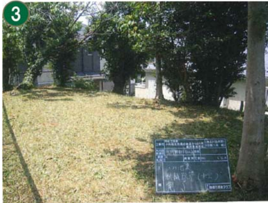
緑地再生等管理事業（熊野神社市民の森）