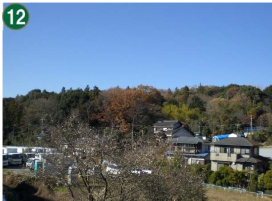
12 特別緑地保全地区指定等拡充事業 （特別緑地保全地区：上菅田町笹山地区）