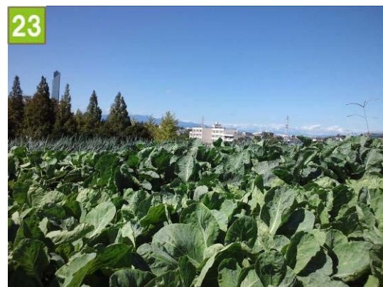
23 集团的農地の維持管理奨励事業 （西谷農業専用地区協議会）