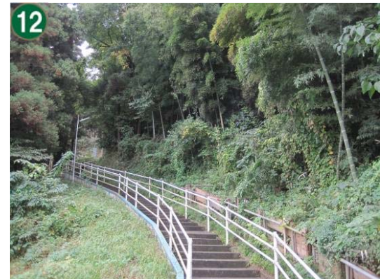
12 特別緑地保全地区指定等拡充事業 （寄附緑地）