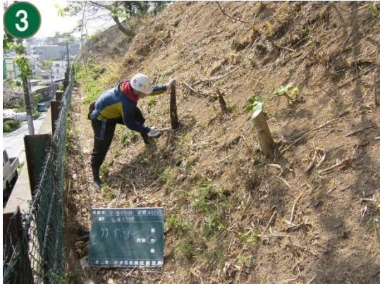
3 緑地再生等管理事業[市民の森等の手入れや下草刈り]（宮田緑地）