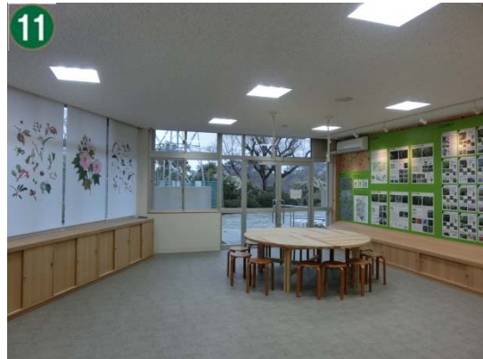
11 ウェルカムセンター整備事業[展示等の設置]（環境活動支援センター）