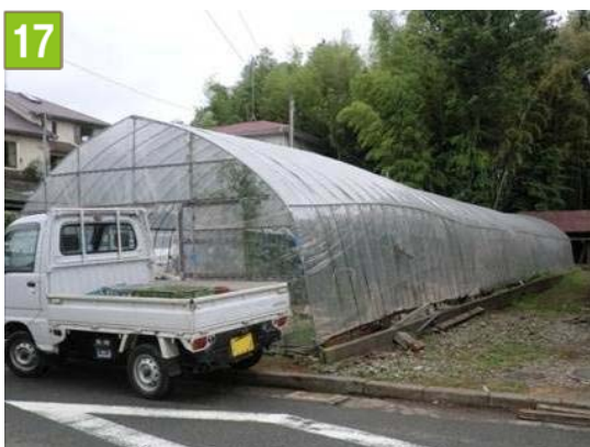
特定農業用施設保全事業[農業用施設用地に対する固定資産税等の軽減を図る契約の締結]（芹が谷五丁目）