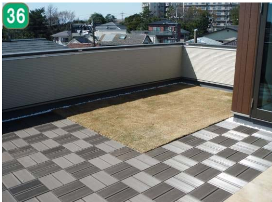
屋上緑化等助成事業（東永谷三丁目）