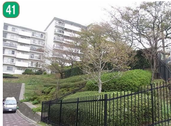
建築物緑化保全契約の締結（上大岡東一丁目）