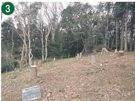
緑地再生等管理事業[市民の森等の手入れや下草刈り]（下永谷市民の森）