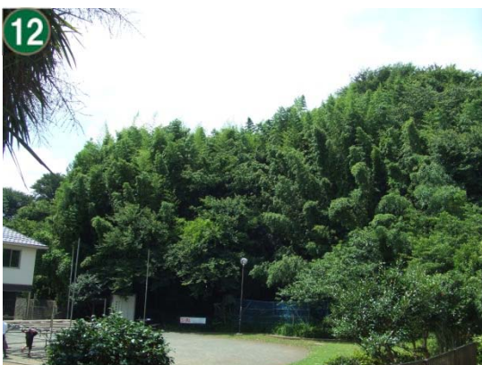
特別緑地保全地区指定等拡充事業 （特別緑地保全地区：港南一丁目地区）