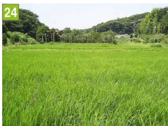
水田保全契約奨励事業（野庭町）