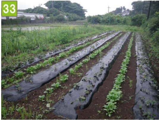
農地流動化促進事業（野庭町）