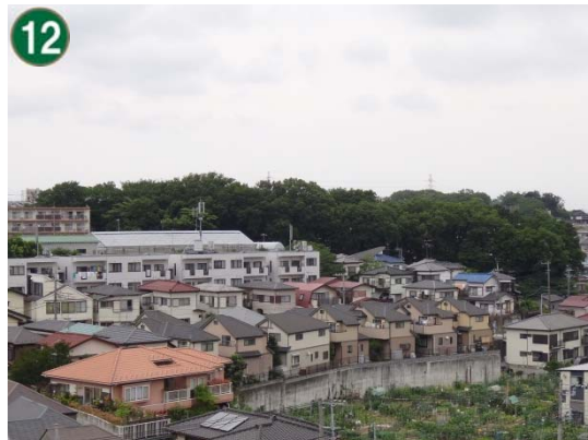
特別緑地保全地区指定等拡充事業 （特別緑地保全地区：芹が谷五丁目地区）