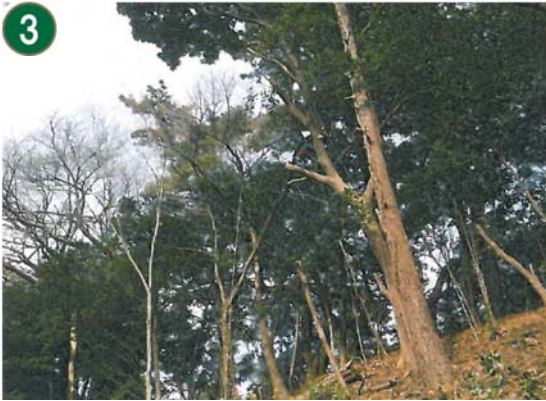
3 緑地再生等管理事業[市民の森等の手入れや下草刈り]（本牧荒井緑地）