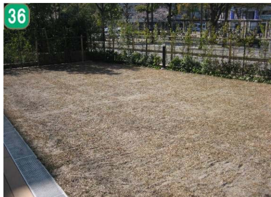
36 保育園・幼稚園芝生化助成事業 （すいとぴー保育園）