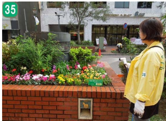
35 地域緑化推進事業[地域緑化計画に基づく緑化整備の実施]（馬車道地区）