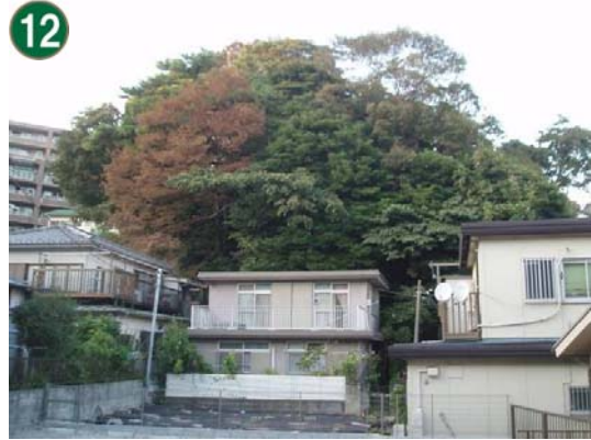
12 特別緑地保全地区指定等拡充事業 （緑地保存地区）