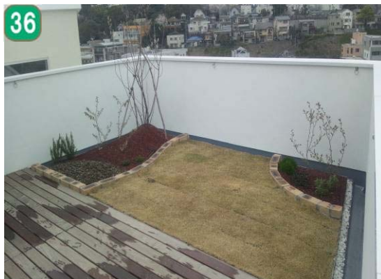
36 屋上緑化等助成事業（鷺山）