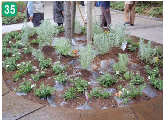
35 地域緑化推進事業[地域緑化計画に基づく緑化整備の実施]（山手地区）