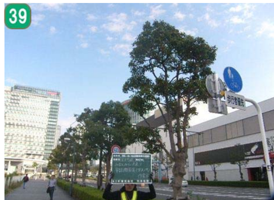
いきいき街路樹事業（施工前）