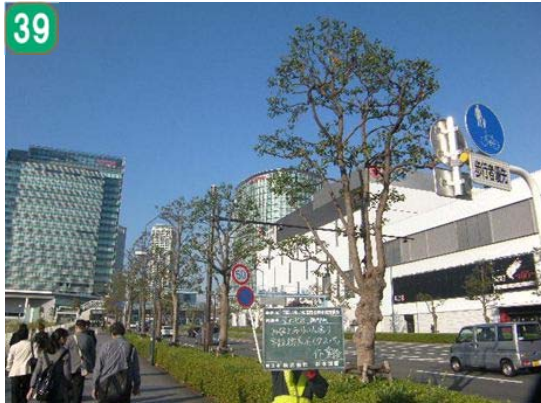
いきいき街路樹事業（施工後）