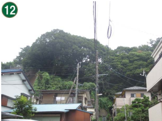
特別緑地保全地区指定等拡充事業 （緑地保存地区）