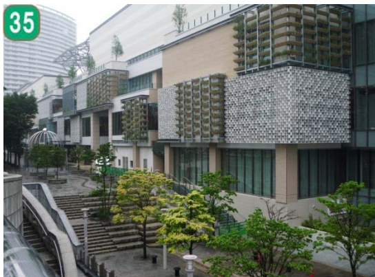
地域緑のまちづくり事業[地域緑化推進 事業]（みなとみらい21 中央地区）