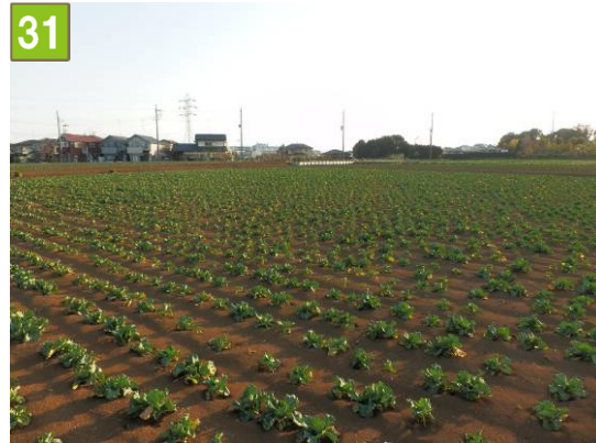
農地貸付促進事業（羽沢町）