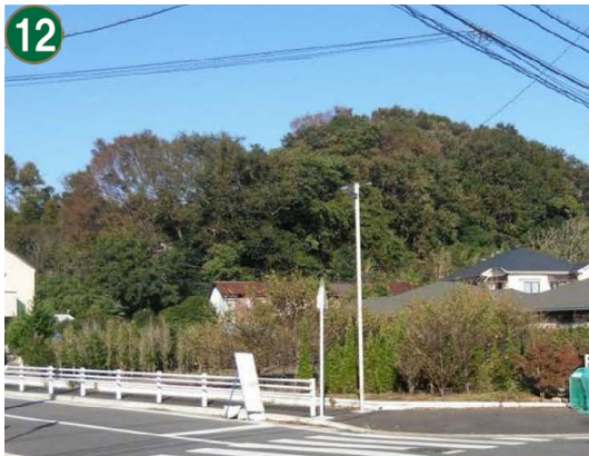
12 特別緑地保全地区指定等拡充事業 （特別緑地保全地区：菅田町出戸谷地区）