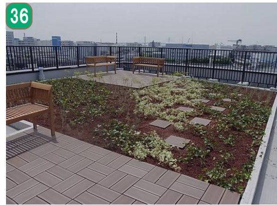
屋上緑化等助成事業（子安通）