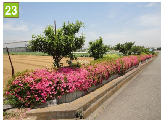
23 集団的農地の維持管理奨励事業 （神奈川農地整備組合）