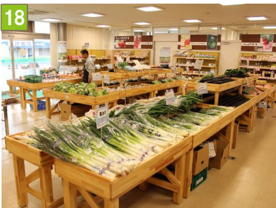
18 共同直売所の設置支援事業 （メルカートかながわ農産物直売所）