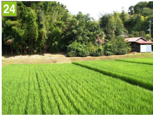
水田保全契約奨励事業（菅田町）