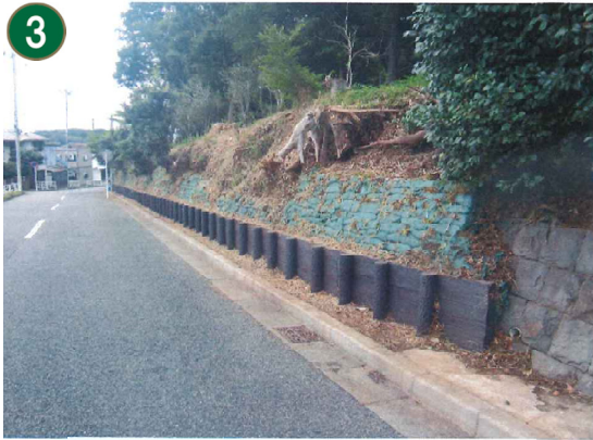
3 緑地再生管理事業〔市民の森等の斜面地での防災対策工事〕（豊顕寺市民の森）