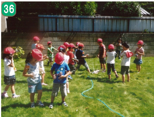
保育園・幼稚園芝生化助成事業 （ニューライフ幼稚園）