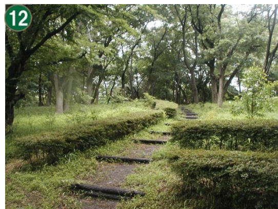
特別緑地保全地区指定等拡充事業 （買取希望等への対応：東寺尾地区）