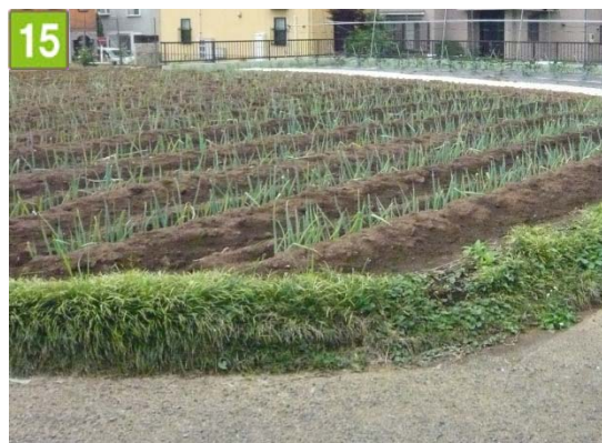
生産緑地制度の活用（馬場七丁目）