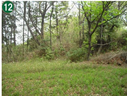
特別緑地保全地区指定等拡充事業 （特別緑地保全地区：北寺尾七丁目地区）