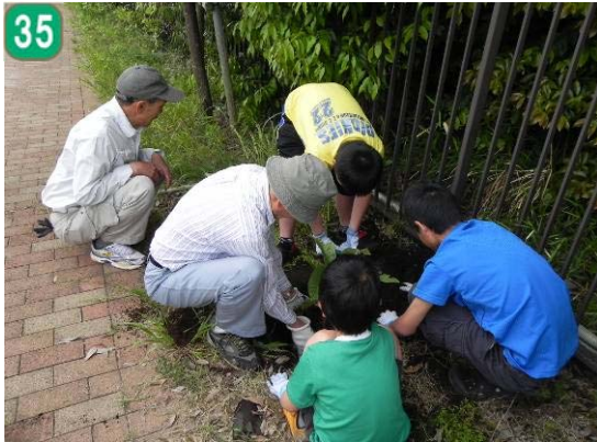
地域緑のまちづくり事業 [地域緑化推進事業] (末広地区)