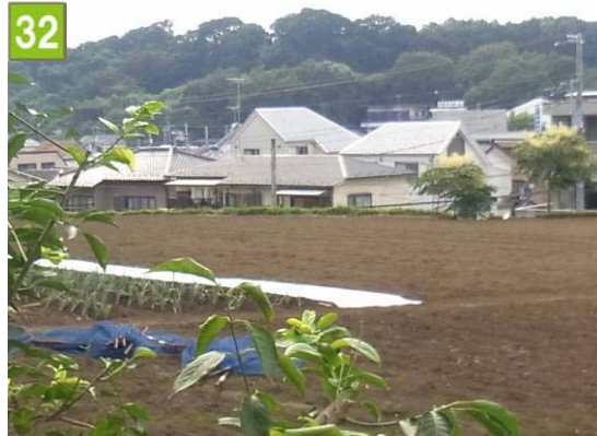
市民農園用地取得事業（東寺尾一丁目）