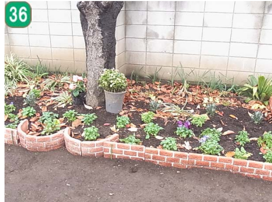
民有地緑化助成事業 [区民花壇事業] (東寺尾東台)