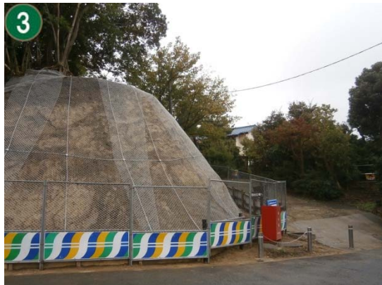
緑地再生等管理事業〔市民の森等の斜面地での防災対策工事〕（獅子ヶ谷市民の森）