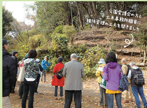
樹木を一度伐採して再び芽吹かせる「萌芽更新」を行った斜面地を視察する様子(茅ヶ崎公園)

市民推進会議では委員が現場を見に行く調査部会を毎年行っています。今年も「みどりアップを見に行こうツアー」と題し、一般参加者と一緒に森づくりの取組などの現場を見に行きました。今回は都筑区の、公園と公園が緑道でつながった緑あふれる街並みを巡り、愛護会や森づくり活動団体の方々、現場を維持管理する市の職員の生の声を聞きました。