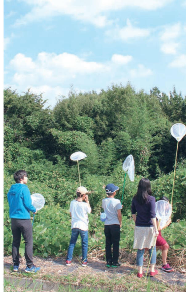
チョウを探しつつ、ほかの生き物も見つけられます