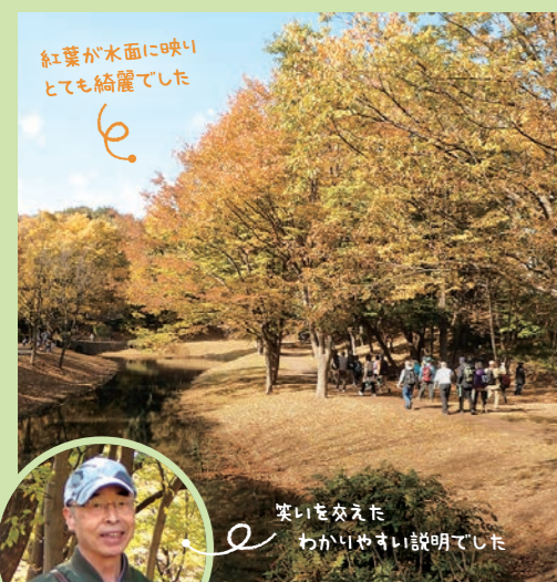
緑道をウォーキングする様子