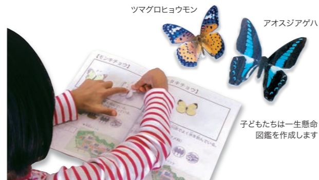
ツマグロヒョウモン

森の散策では、子どもたちは生き生きと元気いっぱいチョウと追いかけて。シジミチョウやセセリチョウなど小型のチョウが沢山見つかりました。「せっかくチョウを見つけても『チョウだ!』の一言で終わってしまってもったいないと思うのです。様々な種類のチョウが、どんな場所にいるか、どのような特徴があるのかなどを知ること、生物多様性への興味が増します。そのため、子どもたちが好きな塗り絵をアレンジして、実物大のチョウの塗り絵を1個1個準備しました。アゲハチョウを基本に、キアゲハの翅の模様はどう違うかなどを観察してもらいました」