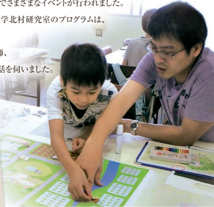
森でチョウを探す前に、みんなでチョウについて学びます

※「大学・都市パートナーシップ協議会」 市内の大学が豊富な知的資源などの蓄積を活かし、市民・企業・行政と連携して活力と魅力あふれる都市を実現するため創設されたもの。