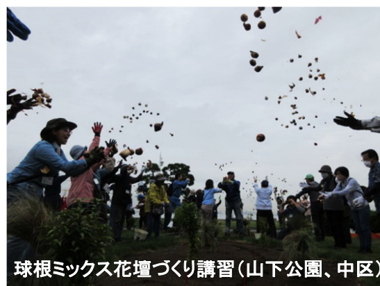
球根ミックス花壇づくり講習(山下公園、中区)