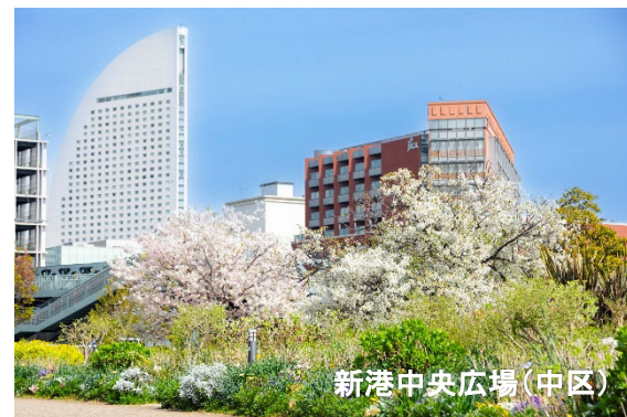
新港中央広場(中区)