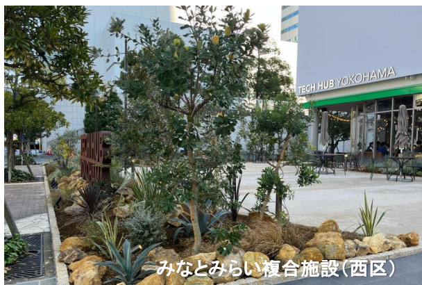
みなとみらい複合施設(西区)