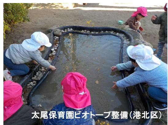
太尾保育園ビオトープ整備(港北区)