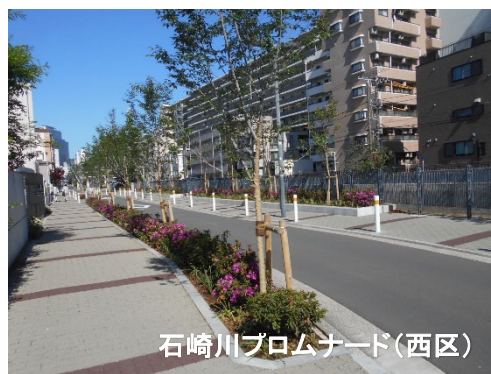
石崎川プロムナード(西区)