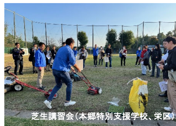
芝生講習会(本郷特別支援学校、栄区)