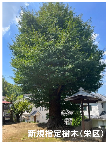
新規指定樹木(栄区)