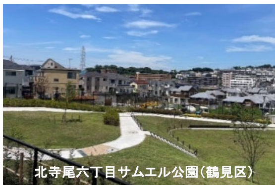
北寺尾六丁目サムエル公園(鶴見区)