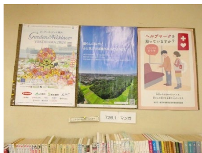
図書館でのポスター掲示