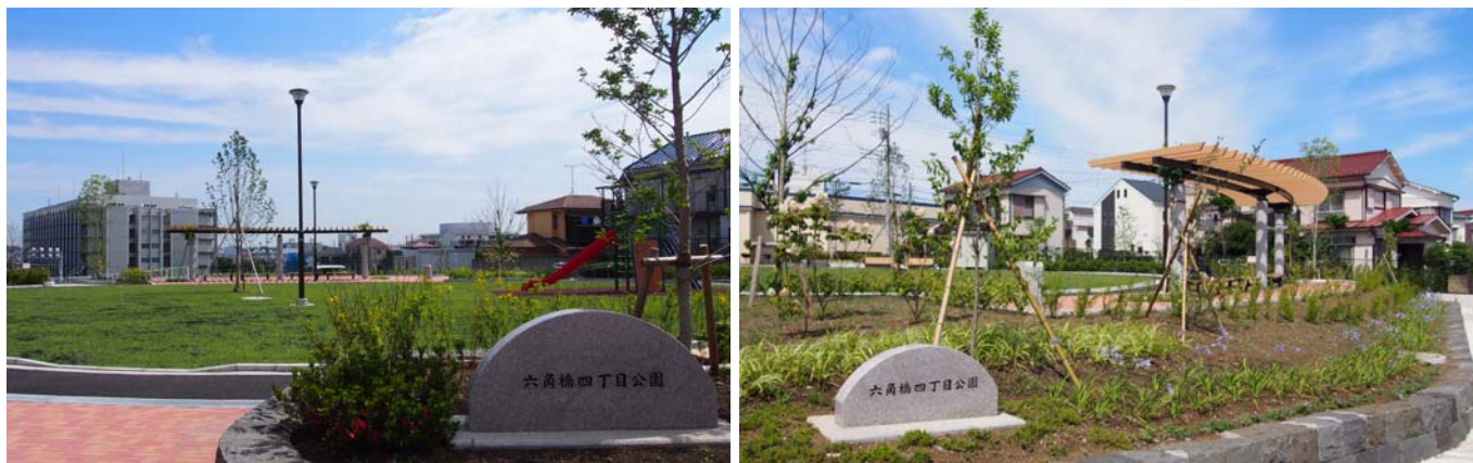
六角橋四丁目公園

横浜みどりアップ計画では、今ある樹林地や農地を守るだけでなく、多くの市民の皆さんの目にふれる場所で、緑豊かな空間を新たに創出しています。今回は、シンボリックな緑の創出・育成の取組として新たに整備された公園をご紹介します！