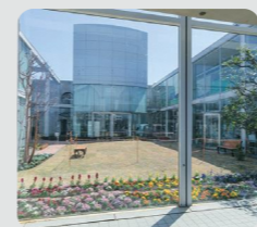
公共施設等での緑の創出 (下和泉地区センター/泉区)