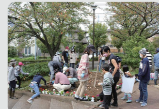
花壇の寄せ植えイベント(青葉区)