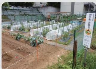
認定市民菜園(青葉区)