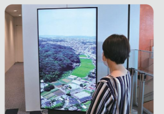
市庁舎デジタルサイネージでの動画放映