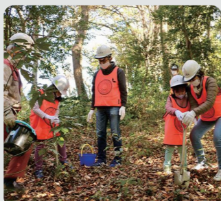
森づくり体験会(緑区)