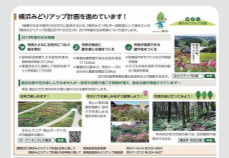
広報よこはまへの取組実績の記事掲載