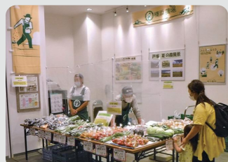
戸塚区地産地消PR・直売コーナー (戸塚区)