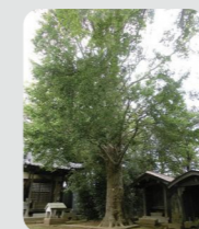
名木古木の指定 (鶴見区)