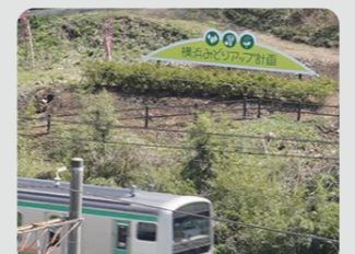
線路沿いでの現地表示看板の設置