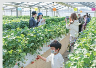
収穫体験農園(神奈川区)