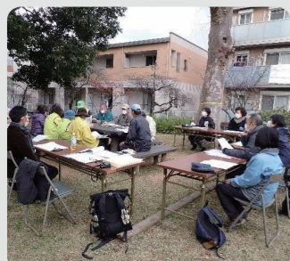
保全管理計画策定の様子 (上矢部ふれあいの樹林/戸塚区)