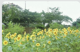
農地縁辺部への植栽(泉区)