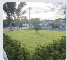
公共施設等での緑の創出 (市立脳卒中・神経脊椎 センター/磯子区)