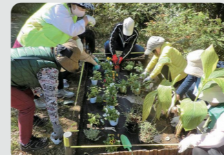
地域緑のまちづくり(港北区)