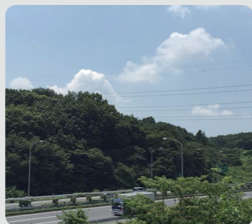
長津田町長月特別緑地保全地区(緑区)