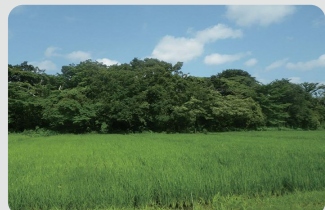
保全された水田(瀬谷区)