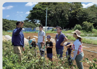
はまふうどコンシェルジュ活動支援 (保土ヶ谷区)