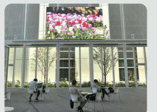
横浜市役所アトリウムでの動画放映