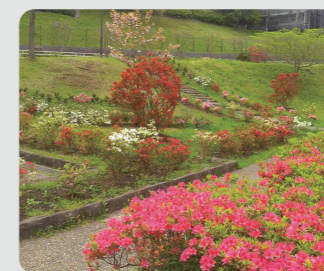
久良岐公園(港南区)