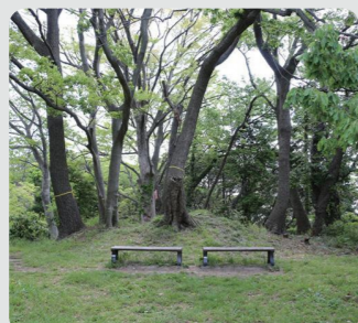
維持管理を実施した樹林地 (称名寺市民の森/金沢区)