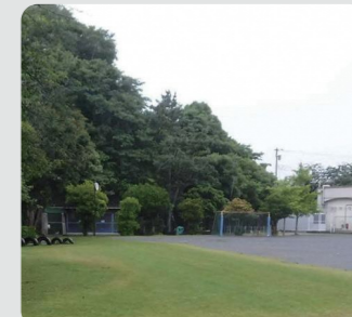
小学校での緑の創出・育成(栄区)