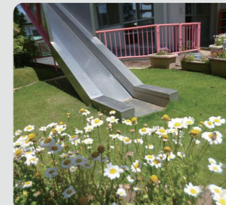
保育園での緑の創出・育成(旭区)