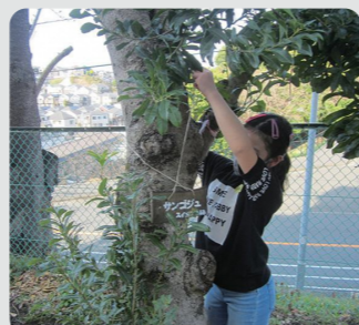
間伐材を活用した樹名板の取付け(南区)