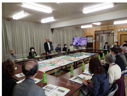
団体による活動の説明