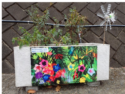
プランターに設置された子供たちの絵