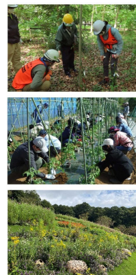
横浜みどりアップ計画5か年の評価・提案 ～横浜みどりアップ計画市民推進会議 2023年度報告書～