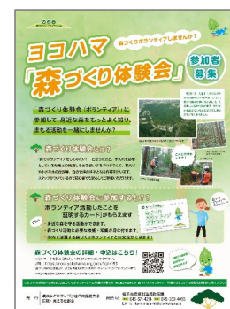
「森づくり体験会」の案内チラシ