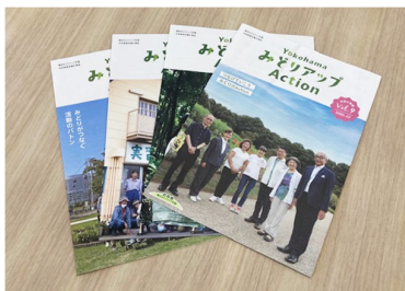
広報誌「YokohamaみどりアップAction」