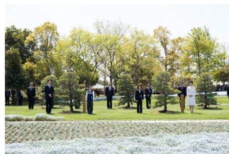
全国都市緑化祭の様子 (浜名湖ガーデンパーク)