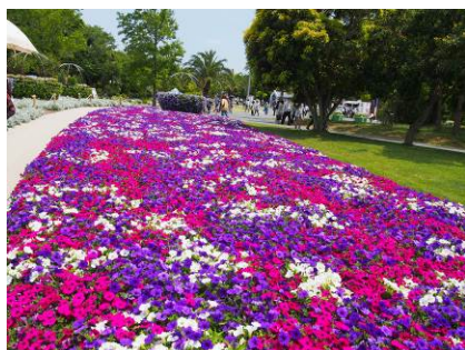
会場風景 (浜名湖ガーデンパーク)

4 月 15 日(火)浜名湖ガーデンパーク(全国都市緑化祭)、5 月 23 日(金)はままつフラワーパーク