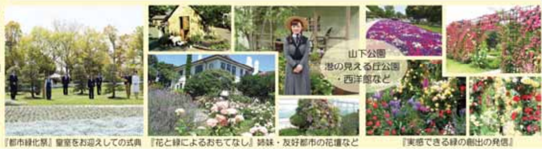
『豊かな横浜の緑を楽しむライフスタイルの提案』 『花や緑による環境未来都市の演出』 『花と緑の展示会』 『都市緑化景観 聖堂をお迎えしての式典』 『花と緑によるおもてなし 錦織・友好都市の花壇など』 『東感できる緑の創出の発信』