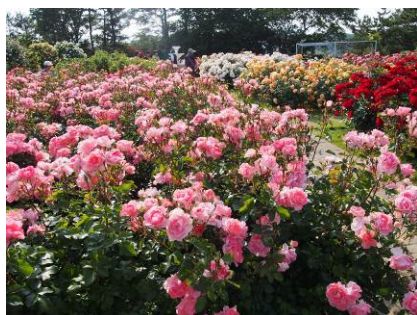
会場風景 (はままつフラワーパーク)